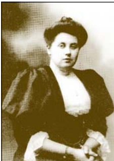
Ἄννα Βυρούμπωβα (1884-1964).

β) ΥΠΑΡΧΟΥΝ πολλὰ ἐνδείξεις, ὅτι ἡ Βασιλικὴ Οἰκογένεια εἶχε πλήρη ἐπίγνωσι, ὅτι ἀνέμενε Αὐτὴν μαρτυρικὸ τέλος καὶ ἐτοιμάζετο συνειδητὰ πρὸς τοῦτο· τὸ μόνον, τὸ ὁποῖο ἐφοβεῖτο ἦταν νὰ μὴν χωρίσουν Αὐτὴν οἱ μπολσεβίκοι ἀπὸ τὴν ἀγαπητὴ Ρωσίαν μὲ ἐξορία στὸ ἐξωτερικόν.