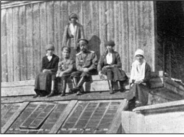
Ἡ Βασιλική Οἰκογένεια ἀπολαμβάνει τὸν ἥλιο, Τομπόσκ 1918.

καὶ πονηρία βασιλεύουν, ἀλλὰ ὁ Ἥλιος τῆς Δικαιοσύνης θὰ λάμψη· μόνο νὰ ἀνοιξῶμε τὰ μάτια μας, τὴν πόρτα τῆς ψυχῆς νὰ κρατήσωμε ἀνοικτή, ὥστε νὰ δεχῶμεθα τὶς ἀκτίνες τοῦ Ἡλίου αὐτοῦ μέσα μας. Ἐμεῖς Τὸν ἀγαπᾶμε, παιδάκι μου, καὶ γνωρίζομε ὅτι “οὕτω δεῖ γενέσθαι”. Μόνον, κάνε ὑπομονὴ ἀκόμη, παιδάκι μου, καὶ ἡ ὁδὴν