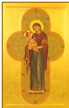
Ἱερὰ Εἰκὼν τῆς Ὑπεραγίας Θεοτόκου στὴν Μονὴ Χουτίν.

Τὸ προπύργιο αὐτὸ τῆς Ὁρθοδοξίας, τὸ ὁποῖο ἔμεινε ἀπείρακτο ἀπὸ τίς πολωνικὲς δυνάμεις κατοχῆς, διεδραμάτισε σπουδαῖο ρόλο στὴν ἀντίστασι τοῦ Ὁρθοδόξου λαοῦ κατὰ τῆς ρωμαιο-καθολικῆς προπαγάνδας.