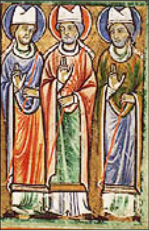
“Ο Άγιος Ρεμίγιος και δύο άλλοι Ίεράρχαι. Μικρογραφία.

Ὑπὸ τὴν πνευματικὴν πλέον καθοδήγησι τοῦ Ἁγίου Ρεμίγιου, ὁ Χλοδοβίκος, ὁ νέος αὐτὸς Μέγας Κωνσταντῖνος, ἐξακολούθησε νὰ συνενώνῃ τοὺς βαρβαρικοὺς καὶ γαλλο-ρωμαϊκοὺς πληθυσμοὺς τῆς Γαλατίας καὶ νὰ καθιστᾷ τὸν λαό του κοινωὸν τῆς ἀληθινῆς Πίστεως.