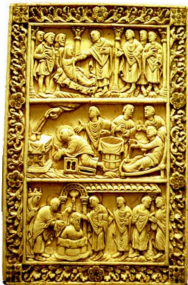
«Τὰ θαύματα τοῦ Ἁγίου Ρεμίου». Ἐπίχρσο ἐλεφαντοστοῦν (880). Le Musée de Picardie, Ἀμιένη.

Ὅταν ὁ Χλοδοβίκος ἀντιμετώπιζε τοὺς Ἀλαμανοὺς στὴν μάχη τοῦ Τολμπιὰκ καὶ οἱ στρατιῶτες του ὑποχωροῦσαν, στράφηκε πρὸς τὸν Θεὸ τῆς Κλοτίλδης καὶ τοῦ Ρεμίου καὶ κατάφερε νίκη λαμπρὰ ἐπὶ τοῦ ἐχθροῦ.