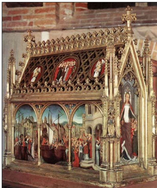
Ἡ Λεῖψανοθήκη τῆς Ἁγίας Οὐρσούλης στὸν ὁμώνυμο Ἱερὸ Ναὸ ἐν Κολωνία τῆς Γερμανίας.

Ὁ Ἱερὸς Ναός, στὸν ὁποῖο κεῖται ἀκόμη καὶ σήμερα τὸ τίμιο Λεῖψανο τῆς Ἁγίας, φέρει τὸ ὄνομα τῆς Ἁγίας Οὐρσούλης τουλάχιστον ἀπὸ τοῦ Η' αἰ.