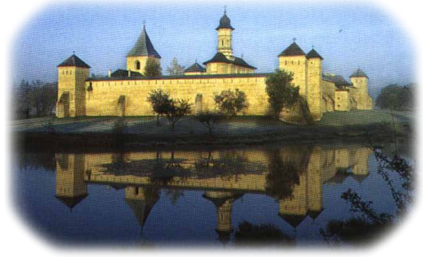
Ἡ Ἱερὰ Μονὴ Ντραγκομίρνα.

μαθητῆ του, ἦλθε στὸ Ἅγιον Ὄρος καὶ ἐγκαταστάθηκε στὴν Ἱερὰ Μονὴ Βατοπαιδίου. Ἐκεῖ ὁ Ἐπίσκοπος τὸν ἔκειρε Σταυροφόρο Μοναχό, ἐνῶ ἀργότερα τὸν ἐχειροτόνησε Διάκονο.