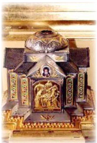
Ἱερά Λείψανα τοῦ Ὁσίου Γεωργίου.

Ἑπακοή στὸν Ἡγούμενο, συχνὴ Ἐξομολόγησι , σωστὴ Διάκρισι τῶν πράξεων καὶ Ταπεινώσι .