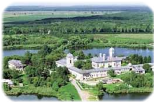
Ἡ Ἱερὰ Μονὴ Τσερνίκα.

Ἡ Σκήτη αὐτὴ, εὐρίσκετο σὲ ἕνα νησάκι μιᾶς λίμνης πλησίον τῆς Τσερνίκα, ὄχι μακριὰ ἀπὸ τὸ Βουκουρέστι, καὶ ἡ ὁποία εἶχε ἰδρυθῆ ἀπὸ τὸν βόρνικο Τσέρνικα. Τ ὸ 1608, γιὰ ἄγνωστο λόγο, ὁ τόπος ἐρημώθηκε καὶ εἶχε καταληφθῆ ἀπὸ ἄγρια θηρία, φίδια, ἀγριογούρουνα καὶ ἄλλα ἄγρια ζῶα, ἐνῶ στὴν Ἐκκλησία φώλιαζαν φίδια καὶ