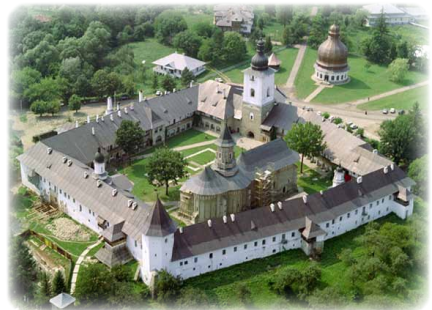
Ἡ Ἱερὰ Μονὴ Νεάμτς.