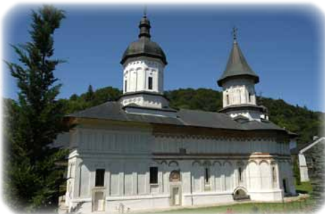
Ἡ Ἱερὰ Μονὴ Σέκου.

Τὸ 1769 μὲ διακόσιους Μοναχοὺς ἐγκατεστάθησαν στὴν Μονὴ τοῦ Σέκου. Ἀργότερα, ἐπὶ διετίαν, ἐγκαταβίωσαν στὴν Μονὴ Νεάμτς, ἡ ὁποία εἶχε ἀναδειχθῆ σὲ κέντρο τοῦ Σλαβικοῦ Μοναχισμοῦ ὑπὸ τὴν καθοδήγησι τοῦ Ὁσίου Παΐσιου.