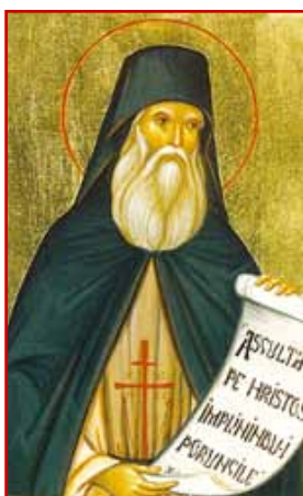
Ὁ Ὅσιος Γεώργιος (1730-1806).