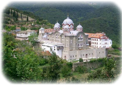
Ἡ Ἱερὰ Σκήτη τοῦ Προφήτου Ἐλίου. Ἅγιον Ὄρος.