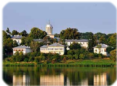
Ἡ Ἱερὰ Μονὴ Καλδαρουσάνι.

Ό Στάρετς Γεώργιος ἐδίδασκε στοὺς μαθητές του νὰ μὴν μεριμνοῦν γιὰ τίποτε ἄλλο, πᾶρεξ γιὰ τὴν δοξολογία τοῦ Κυρίου καὶ τὸ συμφέρον τοῦ πλησίον. Ε λεγε ὅτι ὁ Μοναχικὸς Βίος βασίζεται σὲ τέσσερις θεμελιώδεις ἐντολές: