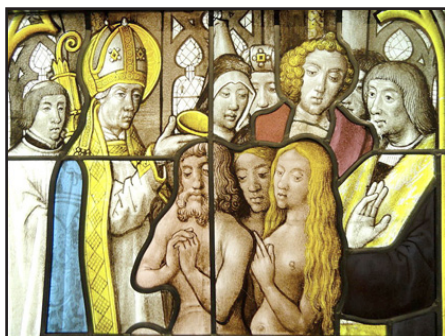
Ὁ Ἅγιος Ἐλευθέριος χρίων καὶ βαπτίζων τοὺς εἰδωλολάτρες.

δωλολάτρες. Τότε μία αἰφνίδιος ἐπιδημία ἐθήρισε τὸν λαό. Οἱ τυφλωμένοι εἰδωλολάτρες ἀπέδωσαν τὴν οὐράνιον παιδευσιν σὲ τεχνάσματα τοῦ Ἐλευθερίου, τὸν ὁποῖον ὠνόμασαν μάγο καὶ ἀπεφάσισαν νὰ θανατώσουν αὐτόν.