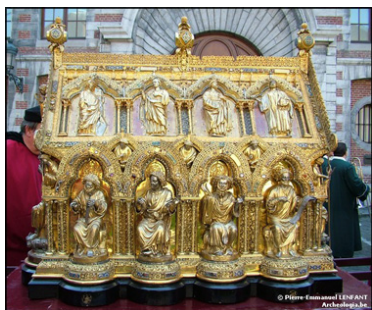
Ἡ ἱερὰ Λάρνακα τοῦ Ἁγίου Ἐλευθερίου.