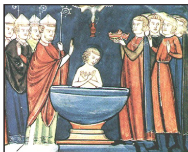
Ἡ Βάπτισις τοῦ Χλωδοβίκου.

Κατὰ τὴν ἐπιστροφή ἀπὸ τὴν τρίτη ἐπίσκεψίν του στὴν Ρώμη, ἔφερε ἅγια Λείψανα τοῦ Ἁγίου Πρωτομάρτυρος Στεφάνου καὶ τῆς Ὁσίας Μαρίας τῆς