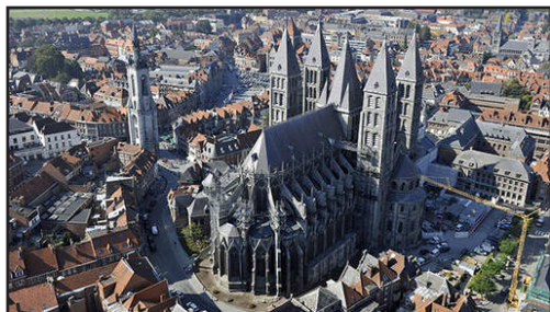
Γενική ἄποψις τοῦ Καθεδρικοῦ Ναοῦ τοῦ Τουρνέ.