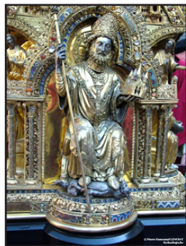
Ὁ Ἅγιος βαστάζων τὸν Ναὸ τῆς Θεοτόκου. (Λεπτομέρεια τῆς Λάρνακος).

Ὁ Ἅγιος Ἐλευθέριος ἔμεινε ὅλη τὴν νύκτα προσευχόμενος ἔνδακρυς. Τὸ πρῶτ' ἐτέλεσε τὴν Θεία Λειτουργία ὑπὲρ τοῦ συντετριμμένου Βασιλέως. Τὴν ὥρα κατὰ τὴν ὁποίαν ἐτοιμάζετο νὰ κοινωνήσῃ τῶν Ἀχράντων Μυστηρίων,