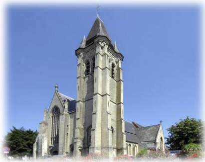
Ὁ Ναός τοῦ Ἁγίου Πιάτ.

Ἡ πρόρρησις αὐτὴ ἐκπληρώθη- κε τὸ 486 ὅταν ὁ Ἐλευθέριος σὲ ἡλικία περίπου 30 ἐτῶν ἐξελέ- γη, προκειμένου νὰ διαδεχθῆ τὸν Ἐπίσκοπο Θεόδωρο καὶ χειροτο- νήθηκε ὑπὸ τοῦ Ἁγίου Ρεμυγίου († Μνήμη: 13η Ἰανουαρίου 533).