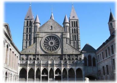
Ὁ Καθεδρικός Ναός τοῦ Τουρνέ.

Ἡ νεάδιδα ἐξῆλθε ἐκ τοῦ μνήματος ἐνώπιον πάντων καὶ ἐζήτησε τὸ Ἅγιο Βάπτισμα.