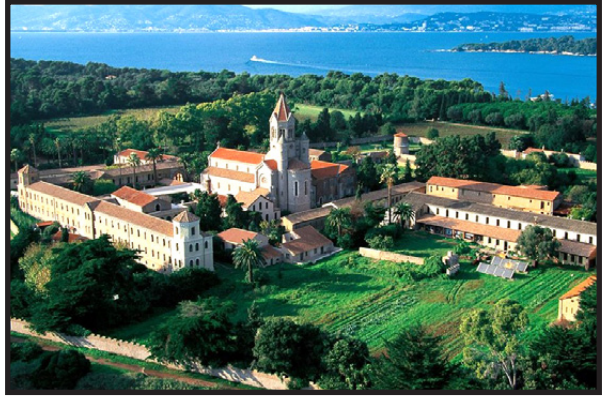
Ἡ ἀνδρῶνα Μονὴ τοῦ Λερίνου.

Βηθλεέμ, ὅπου ἔλαβαν ἀπὸ τὸν Ἡγούμενο τὴν ἄδεια νὰ ζήσουν ἐφεξῆς ὀριστικὰ στὴν Ἔρημο καὶ ἔσπευσαν ὀπίσω στὴν Αἴγυπτο.