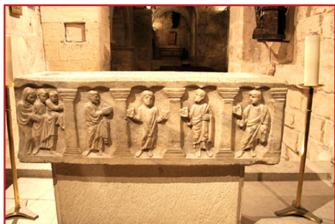
Ἡ ἱερὰ Λάρναξ τοῦ Ὁσίου Κασσιανοῦ.

ναχοῦς, μὲ τὴν βοήθεια τῶν παραδόσεων τῆς Παλαιστίνης, τῆς Καππαδοκίας καὶ τῆς Μεσοποταμίας. Διότι, καθὼς ἔγραφε: «Ἄν πράττωμεν ὅ,τι εἶναι λογικῶς δυνατόν, ἢ τήρησις τοῦ εἶναι ἐξ ἴσου τέλεια, ἀκόμη καὶ μὲ ἄνισα μέσα». Ἐν συνεχείᾳ, ἐκθέτει τὰ ἀντίδοτα στοὺς ὀκτὼ Λογισμούς , οἱ ὁποῖ-