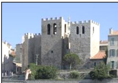
Ἡ ἀνδρῶνα Μονὴ Ἁγίου Βίκτωρος.