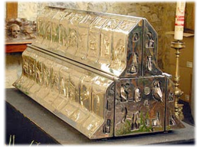
Ἡ Ἱερὰ Λάρνακα τῆς Ἁγίας Γερτρούδης.

Α ίσθανόμενη τὸ ἐπερχόμενο τέλος της, ἐσύναξε τὶς Ἀδελφές, τὶς παῶτρυνε νὰ μένουν πιστὲς στὶς μοναχικὲς ὑποσχέσεις τους καὶ τὶς ἔδωσε ὁδηγίες γιὰ τὸν τρόπο, μὲ τὸν ὁποῖον ἔπρεπε νὰ τὴν ἐνταφιάσουν, σκεπάζοντας τὸ μὲν σῶμα μὲ τὸν τρίχινο χιτῶνα της, τὴν δὲ κεφαλὴ μὲ ἐφθαρμένο πέπλο.