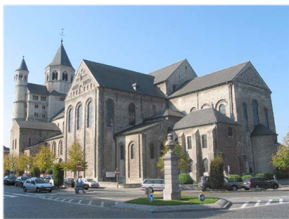
Δυτική άποψη τής Μονής.