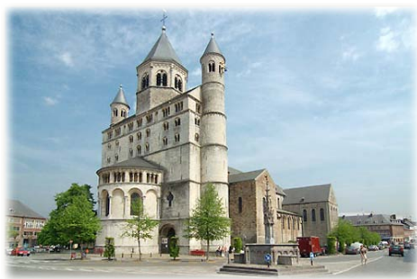
Άνατολική άποψη τής Μονής.

Μ ετά τὸν θάνατο τοῦ Πιπίνου (640) 2 , ἡ σύζυγός του ἀποσύρθηκε μετὰ τὴν Γερτρούδη στὸ κτήμα της στὴν Νιβέλλη (σημ. Νιβέλ, στὸ Βέλγιο). Κ ατὰ συμβουλὴ τοῦ Ἁγίου Ἀμάνδου († Μνήμη: 6η Φεβρουαρίου) ἱδρυσε ἐκεῖ Μοναστήρι μετὰ διπλῆ Ἁδελφότητα Μοναχῶν καὶ Μοναζουσῶν 3 .