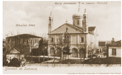
Ἱερὸς Ναὸς Ἁγίας Τριάδος. Σαμψοῦς.

Ὁ ἔμπιστος καὶ στενὸς συνεργάτης Ἀρχιμανδρίτης Πλάτων, ὁ συνκηδευτὴς καὶ ἔθνικὸς Νικόδημος τοῦ σκηνώματος τοῦ πρωτοκορυφαίου τοῦ Μακεδονικοῦ Ἀγῶνος, Παύλου Μελά, ἀφίχθη εἰς Ἀμισὸν κατ' Αὐγούστον τοῦ 1908 καὶ ἐμπειρότατος ὢν, ἀνέλαβε τὴν Πρωτοσυγκελλίαν 6 .