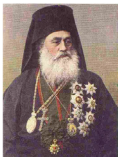
Ἱεράρχης Γερμανὸς Καραβαγγέλης.

πεζοῦντος τὴν διοίκησιν Σαννικῆς καὶ ἐκ τοῦ Βιλαετίου Καστανομῆς τὴν διοίκησιν Σινώπης 2 . Ἐδρα τῆς Μητροπόλεως ἦτο ἡ Ἄμισος ἢ Σαμψοῦς, μία ἐκ τῶν ὠραιότερων πόλεων τοῦ Εὐξεινίου Πόντου.