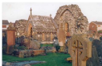
Ἡ Μονὴ τοῦ Ἁγίου Φίννιαν. Ἴρλανδία.

Β ασανιζόμενος ὁμως ἀπὸ τὴν φλόγα τῶν σαρκικῶν πειρασμῶν καὶ ἀναλογιζόμενος τὴν ματαιότητα τῶν ἐγκοσμίων, ἐτέθη ὑπὸ τὴν καθοδήγησι ἐνὸς ἀγίου Γέροντος, τοῦ Σίνελλ, μαθητοῦ τοῦ Ἁγίου Φίννιαν († Μνήμη: 12η Δεκεμβρίου, † 549), ὁ ὁποῖος τὸν εἰσήγαγε στὴν μελέτη τῶν Ἁγίων Γραφῶν καὶ στὴν ἀσκητικὴ πολιτεία.