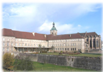
Ἡ Μονὴ τοῦ Λουζέιγ. Γαλλία.

Ἐγκατεστημένος στὸ Λουζέιγ, ὁ Ὅσιος ἐπέβλεπε τὶς τρεῖς Ἀδελφότητες του, οἱ ὁποῖες ἀριθμοῦσαν πολλές ἑκατοντάδες Μοναχοῦς, στηριζόμενος στὴν διακονία ἐνὸς Ἐπιτρόπου σὲ κάθε Μονή, ἐπιφορτισμένου μὲ τὴν τήρησι τοῦ Κανόνος, τὸν ὁποῖο εἶχε συντάξει ὁ ἴδιος ὁ Ὅσιος.