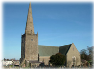
Ἡ Μονὴ τοῦ Μπάνγκορ. Ἴρλανδία.

Π ερὶ τὸ 590, ὁ Κολουμανὸς αἰσθάνθηκε, ὅπως καὶ πολλοὶ ἄλλοι συνασκητές του τὴν ἐποχὴ ἐκείνη, μία ιδιαίτερη κλήσι ὑπὸ τοῦ Θεοῦ νὰ ἐγκαταλείψῃ τὴν πατρίδα καὶ τοὺς οἰκεῖους του,