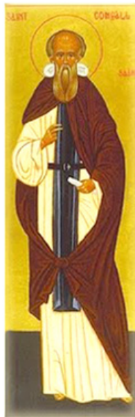
Ο Άγιος Κόμγκαλ.

Π ῆρε τὸ πλοῖο γὰ τὴν Γαλατία μὲ δώδεκα Μαθητές, κατὰ μίμησιν τοῦ Κυρίου μας, καὶ μὲ τὴν καθοδήγησι τῆς θείας Προνοίας ἄρχισε νὰ κηρύττει τὸ Εὐαγγέλιο καὶ τὴν Ὁδὸ τῆς Μετανοίας.