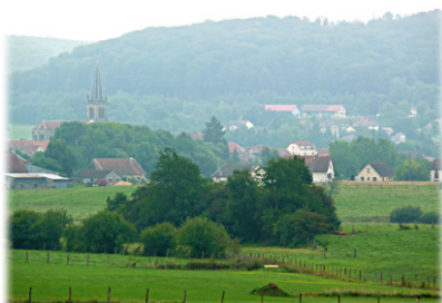
Περιοχὲς τῆς Γαλλίας, στὶς ὁποῖες εὐρισκόταν οἱ Μονεὶς Ἀννεγραι (ἀριστερὰ) καὶ Κρηγῶν (δεξιὰ).