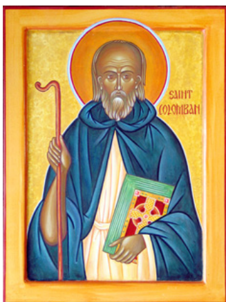
Ὁ Ὅσιος Κολομβανός.

Ὁ διακαῆς πόθος του γιὰ τὸν Θεό, συνδυασμένος μὲ ἓνα φλογερὸ χαρακτήρα, τοὺς ἔκανε ἱκανοὺς μὲν γιὰ ἀσυνήθιστα ἀσκητικὰ κατορθώματα, προσεῖλκυσε ὅμως ἔτι περισσότερο ἐπ’ αὐτῶν τὴν Χάρι τοῦ Θεοῦ καὶ τὴν δύναμι νὰ πραγματοποιοῦν πλεῖστα θαύματα.