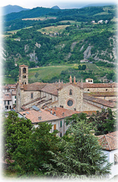
Ἡ Μονὴ τοῦ Μπόμπιο. Ἰταλία.

ἐπειδὴ κατεδίκαζε σθεναρὰ τὶς ἠθικὲς παρεκτροπὲς τοῦ νεαροῦ Ἡγεμόνος.