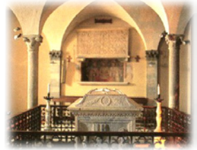
Ἡ ἱερὰ Λάρνακα τοῦ Ὁσίου Κολομβανοῦ. Μονὴ Μπόμπιο.

Τὸ 612, τὸ Βασίλειο τῆς Βουργουνδίας προσάρτησε προσωρινὰ τὴν Αὐστρασία καὶ ὁ Ὅσιος, διωκόμενος πάλι ἀπὸ τὴν ἐχθρα τοῦ Θεοδωρίχου Β', ἀναγκάσθηκε νὰ ἀρχίσῃ ἐκ νέου τὴν περιπλάνησί του πρὸς τὴν Ἰταλία, ὅπου ἐγκαταστάθηκε στὴν Μονὴ τοῦ Μπόμπιο, στὰ Ἀπέννινα.