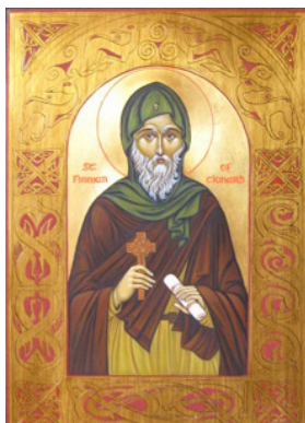
Ο Άγιος Φίννιαν.

διάδοσι καὶ ἐμβάθυσσι τοῦ Χριστιανισμοῦ σὲ ὁλόκληρη τὴν Δύσι κατὰ τὴν περίοδο ἐκείνη.