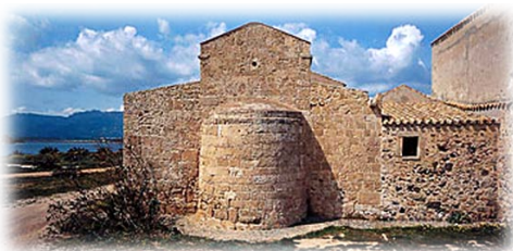
Ὁ Ναὸς στὸν τόπο Μαρτυρίου τοῦ Ἁγίου Ἐπισίου.

Ὁ Ἰούλιος σὲ μεγάλῃ σύγχυσι, ἐγκατέλειψε τὸ νησί, ἀφήνων τὸν Φλαβιανὸ στὴν θέσι του.