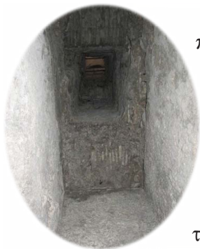
Ἡ φυλακὴ τοῦ Ἁγίου Ἐφισίου.

Ὁ Ἰωάννης, φοβούμενος μήπως τιμωρηθῆ, προσεπάθησε νὰ σβῆσῃ τὶς εἰκόνες καὶ τὶς ἐπιγραφές, ἀλλὰ ὅλες οἱ προσπάθειές του ἀπέβησαν μάταιες.