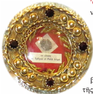
Τὸ ἱερὸ Λεῖψανο τοῦ Ἁγίου Ἐφισίου.

Ὁ νέος Διοικητὴς ἐνόμιζε, ὅτι θὰ δυνηθῆ νὰ νικήσῃ τὴν ψυχὴ τοῦ Ἐφισίου καὶ προσεπάθησε καὶ ἐκεῖνος νὰ τὸν πείσῃ μὲ κολακεῖες νὰ λατρεύσῃ τὰ εἰδωλα.