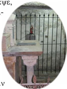
Ἡ φυλακὴ τοῦ Ἁγίου Ἐφισίου.

Ὄταν ὁ Ἅγιος Ἐπίσιος ἔφτασε στὸ Κάλιαρι, οἱ Χριστιανοὶ μὲ τὸν Ἐπίσκοπό τους Ἅγιο Ἰανουάριο († Μνήμη: 21 Ἀπριλίου), ἐδοκίμασαν τὸν ἴδιο φόβο μὲ τοὺς πιστοὺς τῆς Δαμασκού στὴν ἄφιξι τοῦ Σαύλου.