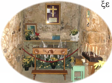
Ὁ τόπος τοῦ Μαρτυρίου τοῦ Ἁγίου Ἐφισίου.

Π ολλοί, ἀκόμη καὶ ἀπὸ τοὺς εἰδωλολάτρες, ἔφριξαν βλέποντες τόσο ἀπάν-