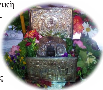
Ἡ Κάρα τοῦ Ἁγίου Ἰγνατίου.

καὶ σχολεῖα ποὺ δίδασκαν τὴν ἑλληνικὴ γλῶσσα καὶ ἱστορία καὶ κρατοῦσαν ζωηρὴ καὶ ἀνόθευτη τὴν ταυτότητα τοῦ γένους μας. Στὰ σχολεῖα αὐτὰ καὶ μάλιστα στὴν περίφημη «Λειμωνιάδα» Σχολή, δίδασκε ὁ ἴδιος ὁ Ἅγιος, ὁ υἱὸς τοῦ Μεθόδιος, ὁ σοφὸς Παχώμιος Ρουσαῖνος καὶ ἄλλοι σοφοὶ διδάσκαλοι.