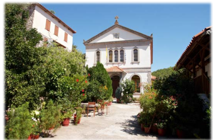
Ἡ Ἱερὰ Μονὴ Μυρσινιώτισσας.

Ἢ Ἅγιος Ἰγνάτιος μὲ μεγάλο καὶ θερμὸ ζῆλο ἀξιοποίησε τὰ κτήματα αὐτὰ γιὰ ἱεροὺς σκοποὺς. Μ ὲ προσωπικὴ του δαπάνη ἐπισκεύασε τὸ ἐρειπωμένο Μοναστήρι τῆς Μυρσινιώτισσας. Μ ὲ τὸν ἴδιο ζῆλο ἵδρυσε τὸ Μοναστήρι τοῦ Λειμώνος καὶ ἀντὶ τοῦ μικροῦ ξωκκλησίου τοῦ Ἀρχιστρατήγου Μιχαήλ ἔκτισε λαμπρὸ Ναό, μεγάλο, ἀπαραίτητο γιὰ τοὺς πολλοὺς Μοναχοὺς ποὺ εἶχαν μαζευτεῖ ἐκεῖ, ἀλλὰ καὶ τῶν πολλῶν προσκυνητῶν ποὺ ἐρχότανε στὸ Μοναστήρι.