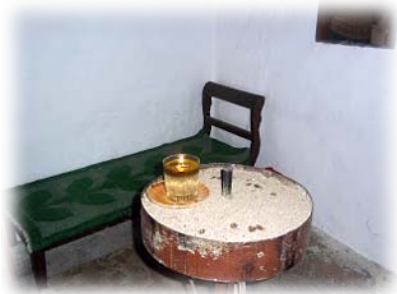
Τὸ κελλάκι τοῦ Ἁγίου Ἱγνατίου.