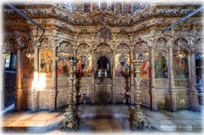
Τὸ Καθολικὸν τῆς Ἱερᾶς Μονῆς Λειμώνος.

Γ ιὰ νὰ κατοχυρώσει τὸ Μοναστήρι ἀπὸ τὶς ἀρπακτικὰς διαθέσεις τῶν Τούρκων, ἀλλὰ καὶ τῶν κακῶν γειτόνων, πῆγε στὴν Κωνσταντινούπολη καὶ κατόρθωσε νὰ ἐκδοθεῖ Πατριαρχικὴ Πράξις τὸ ἔτος 1530, καὶ διατάγματα τῆς