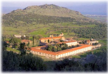
Ἡ Ἱερὰ Μονὴ Λειμώνος. Λαριθμεῖ 208 παρεκκλήσια.

ἦθε Ἱερεὺς καὶ πῆρε τὸ ὄφθικιο τοῦ Σακελλίωνος.