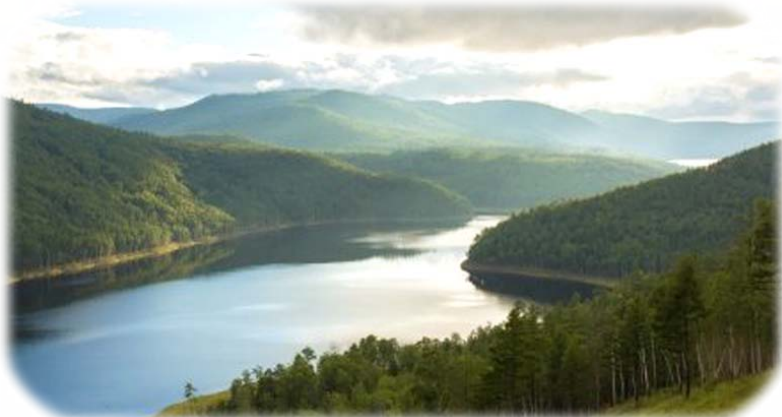
Ὁ ποταμὸς Ἀμούρ, ὁ ὁποῖος χωρίζει τὴν Ρωσία ἀπὸ τὴν Κίνα.

Διασώθηκαν μόνο 150 στρατιῶτες ἀπὸ τοὺς 826 , οἱ ὁποῖοι πολέμοῦσαν. Οἱ δυνάμεις ἦσαν ἀνεπαρκεῖς γιὰ νὰ συνεχισθῇ ὁ πόλεμος μὲ τοὺς Κινέζους. Τὸν Αὐγούστο τοῦ 1690 , οἱ τελευταῖοι Κοζάκοι μὲ ἐπὶ κεφαλῆς τὸν Βασίλειο Σμιρεννικὸβ –ἐναν ἀπὸ