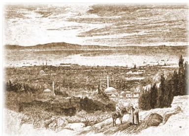
Ἡ Σμύρνη σὲ γκραβούρα τοῦ 1876.

Ὁ Γρηγόριος, ἐπιθυμώντας νὰ δεῖ τὴν γενέθλια γῆ, ταξίδεψε στὴν Δημητσάνα καὶ γιὰ νὰ ἐπισκεφθεῖ τοὺς λίγους ἐναπομείναντες συγγενεῖς του.