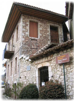
Ἡ πατρικὴ οἰκία τοῦ Πατριάρχου Γρηγορίου Ε΄ στὴν Δημητσάνα.

σίας, τῆς παιδείας καὶ τοῦ Ἔθνους, ὄχι τυχοῦσαν 1 .