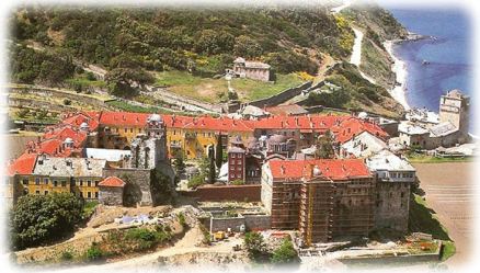
Ἡ Ἱερὰ Μονὴ Ἰβήρων.

Στὸ Ἅγιον Ὅρος ἐξέλεξε γιὰ κατοικία τὴν Μονὴν τῶν Ἰβή- ρων καὶ κάποτε τὴν Λαύραν, ἀπολαμβάνοντας τὴν ἐλευθερίαν τῶν ἀσκητικῶν ἀγῶνων, κηρύσ- σοντας τὸν θεῖον λόγον συνεχῶς στὶς Ἐκκλησίες, ἐξομαλύνον- τας τὶς διαφορὲς ποὺ προέκυπταν στὰ Μοναστήρια, ὄντας ὁ ἴδι- ος ὑπογραμμὸς τῆς μοναχικῆς ζωῆς 38 .