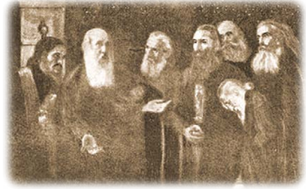
Ὁ Μητροπολίτης Ἀγχιάλου Εὐγένιος Καραβίας μιλά στοὺς συγκρατούμενους του στὴν φυλακὴ. (Ἔργο Ἔκτ. Δοῦκα).

Ἀπὸ τότε αὐξανόταν κάθε μέρα ἡ ὀργὴ τῶν Τούρκων κατὰ τῆς Ἐκκλησίας καὶ ὁ Πατριάρχης φυσικὰ προαισθάνθηκε καὶ τὸ τέλος του ὡς ἐκπλήρωση τῆς θείας βουλῆς 52 . Ἡ Πύλη ὑποχρεώνει τὸν Πατριάρχη νὰ φυλάξει στὰ Πατριαρχεῖα ἑπτὰ ἀντιπροσώπους τῆς Σερβίας 53 .