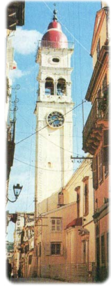
Μέρος τοῦ Ναοῦ τοῦ Ἁγίου Σπυρίδωνος εἰς τὴν πόλιν τῆς Κερκύρας, μετὸ πανύψηλον κωδωνοστάσιον, ἀπὸ τὴν κορυφὴν τοῦ ὁποίου ἐξεπέμφθη λάμψις πυρός πρὸς τὴν πυριτιδαποθήκην, τὴν νύκτα τῆς 11-12.11.1718.

Τ όσον καλὰ τὸ ἐκατάλαβαν, πῶς ἦτον ὀργὴ τοῦ Ἁγίου Σπυρίδωνος, ὥστε ποῦ μὴν ὑποφέροντες νὰ τὸ κηρύττῃ με ὄλην τὴν παρρησίαν ὁ Ἴταλὸς ἐκεῖνος Σολδατός*, τὸ ὀγληγορώτερον τὸν εὐγαλαν ἀπὸ τὴν Νήσον, ἀποστείλαντες αὐτὸν εἰς τὴν Ἴταλίαν.