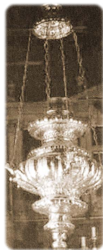
Ἡ Κανδήλα εἰς ὃν Ναὸν τοῦ Ἁγίου Σπυριδωνος.

Ὁ Σολδατός* πόθεν εὐρέθῃ εἰς τὴν Σπιανάδα*; Π ῶς ἄφησε τὸ πόστον του, καὶ ἔλειψε ἀπὸ τὸ χρέος του, διὰ τὸ ὁποῖον ἀπόκειται κεφαλικὴ τιμωρία, ὅποιος κἄν μίαν στιγμὴν ἢ ἓνα πάτημα λείψῃ ἀπὸ τὴν τάξιν του; Ἀ λλὰ καὶ πῶς ἦτο δυνατὸν ἄλλως νὰ γένη εἰς ἓνα καιρόν, ἦτοι μεσονυκτίου, ὁποῦ ἦτον δυνατὰ καὶ ἀσφαλέστατα κλεισμέναις οἱ πόρταις καὶ τῶν δύο Κάστρων;