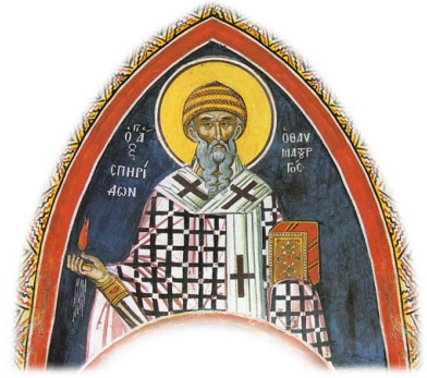
Ἐπερ᾽ Εἰκῶν τοῦ Ἁγίου Σπυρίδωνος. Ἐπερ᾽ Μονῆ Διονυσίου, Ἁγίου Ὄρους.

Σαλπίζομεν, λοιπόν ἡμεῖς οἱ ὁμόπιστοι καὶ ἀδελφοὶ τῶν Κερκυραίων Ὁρθοδόξων, μὲ τὸ νὰ εὐρισκώμεθα, Θεοῦ Προνοία, μακρὰν ἀπὸ τοὺς φόβους ἐκεῖνους, καὶ μὲ τὸν Προφητάνακτα Δαβίδ, φω-