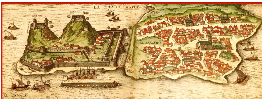
Ἀποψις τῆς πόλεως Κερκύρας καὶ τοῦ παρακειμένου νησιδίου, εἰς τὸ ὅποιον ἔγινεν ἡ «Οὐρανοῦ Κρίσις». Χάρτης τοῦ 1575.

Μέσα εἰς τὴν Χώραν εἶναι καὶ ὁ Ναὸς τοῦ Ἁγίου καὶ ἡ Μητρόπολις τῶν Δυτικῶν. Ἐκεῖ εἶναι ἡ Σπιανάδα*, τὴν ὁποῖαν ἀναφέρει ἡ διήγησις. Ἐκεῖ καὶ ἡ προειρημένη Ἐκκλησία τοῦ Ἐσταυρωμένου, εἰς τὴν ἀρχὴν τῶν ὀσπητίων, εἰσερχομένου σου ἀπὸ τὴν Σπιανάδαν*, εἰς τὸν κοινὸν δρόμον τῆς Πόλεως, οἰκοδομημένη.