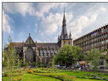
Ὁ Καθεδρικός Ναὸς τοῦ Ἀγίου Λαμβέρτου στὴν Λιέγη.

Μολονότι ὁ Ἅγιος Λαμβέρτος εἶχε δεχθεῖ πολλὰ εὐεργεσίες ἀπὸ τὸν Πιπίνον, ἐν τούτοις προσηλωμένος στὸν θεῖο νόμον δὲν προσωποληπτοῦσε· ὑπῆρξε ὁ μοναδικὸς Ἐπίσκοπος ποὺ τόλμησε νὰ ἐλέγξει δημοσίως τὸν Ἡγεμόνα, διότι εἶχε διαζευχθεῖ τὴν νόμιμη γυναῖκα του, προκειμένου νὰ συζήσει μὲ μία παλλακίδα. Προσβεβλημένη αὐτὴ ἀπὸ τὴν ἀδι-