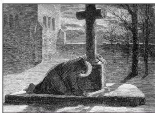
Σχέδιο Ἀγίου Λαμβέρτου. 10 ο αἰ.

θόρυβο καὶ διετάραξε τὴν νυκτερινὴ μοναστηριακὴ ἡσυχία. Ὁ Ἡγούμενος ἐπέβαλε στὸν αἴτιο τοῦ θορύβου – χωρὶς νὰ γνωρίζει ποιοὺς ἦταν – τὸ ἐπιτίμιο νὰ σταθεῖ ὄρθιος ἕως τὴν ὥρα τοῦ ὄρθρου, μὲ τὰ πόδια γυμνὰ μέσα στὸ χιόνι, μπροστὰ στὸν σταυρὸ ποὺ ἦταν στημένος ἔξω ἀπὸ τὴν Ἐκκλησία. Ὁ