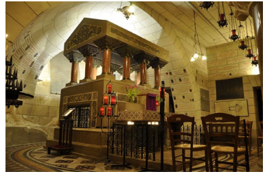
Ὁ ἱερὸς Τάφος τοῦ Ἁγίου Μαρτίνου.

Χαρακτηριζόμενος, ως τὸ Ἄσκη- τικὸ Θαῦμα τῆς Δύσεως, ἄσκησε τέ- τοια ἐπιρροή στὴν Γαλατία ἀνάλογη μὲ ἐκεῖνη τοῦ Ἁγίου Ἀντωνίου τοῦ Μεγάλου στὴν Αἴγυπτο.