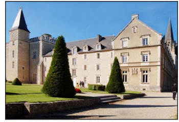
Ἡ Μονὴ τοῦ Ἁγίου Μαρτίνου στὸ Λιγκουζέ.

ρα έναν πτωχὸ ἄνθρωπο νὰ ξεπαγιάζει γυμνὸς στὶς πύλες τῆς πόλεως. Β λέποντας πὼς κανεὶς δὲν συνεκινεῖτο ἀπὸ τὸ θέαμα, καὶ μολοντί δὲν φοροῦσε παρὰ μόνον τὴν χλαμύδα του, ἔχοντας ἤδη μοιράσει σὲ ἐλεημοσύνες ὅ,τι εἶχε καὶ δὲν εἶχε, ὁ δοῦλος τοῦ Θεοῦ ἔπιασε τὸ ξίφος του, ἔκοψε στὰ δύο τὴν χλαμύδα, ἔδωσε τὴν μισὴ στὸν φτωχὸ καὶ τυλίχθηκε ὁ ἴδιος μὲ τὴν υπόλοιπη, παρὰ τὶς κοροϊδίες τῶν ἄλλων γύρω. Τ ὴν ἐπόμενη νύκτα εἶδε νὰ ἐμφανίζεται ὁ Χριστὸς, φορώντας τὸ κομμάτι τῆς χλαμύδας, μὲ τὸ ὁποῖο εἶχε καλύψει τὸν φτωχό, καὶ Τὸν ἄκουσε νὰ λέει στὸ πλῆθος τῶν Ἀγγέλων πού Τὸν περιέβαλλαν: « Ὁ Μαρτίνος, Κατηγούμενος ἀκόμη, μὲ σκέπασε μὲ τὸ ἔνδυμα αὐτό».