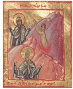
Βυζαντινὸ Μηνολόγιο τοῦ ΙΔ' αἰ. Βιβλιοθήκη Μπόντλε- αν (Bodleian Library), Ἄγγλεια, Ὁξφόρδη.

Μετὰ ἀπὸ ἑξὶ ἡμέρας, ἔδωσε τὶς τελευταῖες συμβουλές της στοὺς