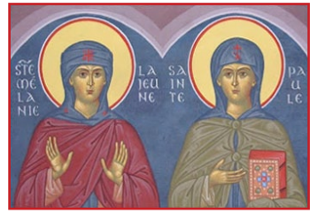
Ἡ Ὁσία Μελάνη ἡ Νεωτέρα καὶ ἡ Ἁγία Παῦλα.

Τελικά, χάρις στὴν παρέμβασι τῆς Αὐτοκράτειρας, ἡ Μελάνη ἀπελευθέρωσε 8.000 δούλους της, δίνοντας στὸν καθένα τρία χρυσὰ νομίσματα· κατόπιν, μὲ τὴν μεσολάβησι ἀνθρώπων ἔμπιστων, δαπάνησε ἀφθονο χρυσὸ σὲ Δύσι καὶ Ἀνατολή: σχεδὸν παντοῦ ἵδρυσεν Ναοὺς καὶ Μοναστήρια· χρυσός, πολύτιμοι λίθοι, σκευὴ καὶ ἀνε-