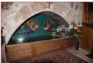
Ό Τάφος της Όσίας Μελάνης. Έεροσόλυμα.

Ό πνευματικός άδελφός της Πινιανός έκοιμήθη τó 432. Τόν έθαψε πλάι στην μητέρα της Άλβίνα, πλησίον του σπηλαιού όπου ó Χριστός είχε προφητεύσει στους Μαθητές Του τόν άφανισμό των Έεροσολύμων, και έγκαταβίωσε έπί τέσσερα χρόνια σ΄ ένα κελλι δίχως κανένα άνοιγμα, τελείως άποκομμένη από τόν κόσμο· κατόπιν άνέθεσε στόν μαθητή και βιογράφο της, τόν Έερέα Γερόντιο, να ίδρύση άνδρóa Μονή, και αυτή άνέλαβε την πνευματική καθοδήγησι των Μοναχών –σπάνια περίπτωσι στα χρονικά της Έκκλησίας.