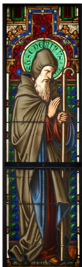
Βιτρώ μὲ τὸν Ἅγιο Σεβερίνο. Ναὸς Σγουέτλ (Zwettl) Ἀυστρία.

Τρεῖς ἡμέρες ἀργότερα ἓνας σεισμὸς ἔσπειρε πανικὸ στοὺς βαρβάρους ποὺ τράπηκαν σὲ φυγὴ ἀλλοσφαζόμενοι καὶ ἡ πόλις ἀπελευθερώθηκε.