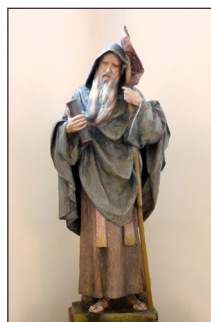
Ἄγαλμα τοῦ Ἁγίου Σεβερίνου. Ναὸς στὸ Μάουτερν (Mautern), Κάτω Ἀυστρία.

Τὸ 473, ὁ Ἅγιος Σεβερίνος, προέβλεψε ἐπίθεσι τῶν βαρβάρων κατὰ τῆς ἐπαρχίας του καὶ ἔδωσε