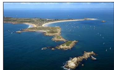
Νῆσος Οὐάτ (Βρετάνη, Ile-d'Houat, Brittany).