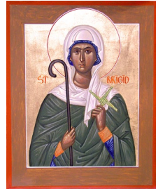
Ἡ Άγία Μπριγκίτα.

17η Μαρτίου). Διατηρούσε φιλικές σχέσεις με την Άγία Μπριγκίτα του Κιλνταϊρ († Μνήμη: 1η Φεβρουαρίου) και λέγεται, ότι τῆς κατεσκεύασε μία λάρνακα και μία καμπάνα.