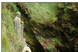
Ἀνδριάντας τοῦ Ὁσίου Γιλδασίου, πλησίον τοῦ ὁμώνυμου χωριοῦ (Γαλλία, Saint- Gildas-de-Rhuys).

Ἁγίου τὴν σωματικὴ καὶ ψυχικὴ τους ὑγεία, ἐνῶ ἡ Μονὴ τοῦ Ρουΐς ἀπέβη κέντρο γιὰ τὸν ἐκχριστιανισμὸ ὅλης τῆς χώρας.