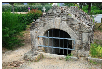
Μονὴ Ὁσίου Γιλδασίου (ἀριστερά), ἀγίασμα Ὁσίου Γιλδασίου (δεξιὰ), στὸ ὁμώνυμο χωριό, (Γαλλία, Saint-Gildas-de-Rhuys).