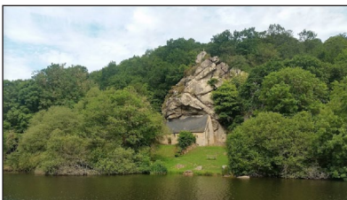
Ναὸς τοῦ Ὁσίου Γιλδασίου, στὶς ὄχθες τοῦ ποταμοῦ Μπλαβέ.

Μὲ τὴν μεσιτεία τοῦ Ἁγίου, τῆς διδαχῆς καὶ τῆς προσευχῆς του μὲ τὰ θαυματουργὰ ἀποτελέσματα, ὁ ἴδιος ὁ Θεὸς ἦταν ὄντως παρὼν ἐν δυνάμει στὴν περιοχὴ ἐκεῖνη. Πολλοὶ ἄρρωστοὶ εὕρισκαν διὰ τοῦ