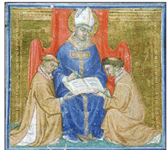
Ὁ Ἅγιος Ἰλάριος Ἀρελάτης.

Ἡ φήμη τοῦ Ἁγίου Ρωμανοῦ ἔφθασε μέχρι τὸν Ἅγιο Ἰλάριο Ἀρελάτης († Μνήμη: 5η Μαΐου), τὸν ἐπὶ κεφαλῆς τῆς Ἐκκλησίας τῆς Γαλατίας, ὁ ὁποῖος τὸν ἐχειροτόνησε Πρεσβύτερο, κατὰ τὴν διάρκεια μιᾶς ἐπισκέψεώς του στὴν Μπεζανσόν, ὥστε νὰ ὑπηρετῆ καλύτερα τὶς λειτουργικὲς ἀνάγκες τῆς Ἀδελφότητος (444). Ἀλλὰ ὁ Ρωμανὸς ἤξερε τόσο καλὰ νὰ παραμένῃ ταπεινός, ὥστε ἐκτὸς τῆς τελέσεως τῆς Θείας Λειτουργίας, ἦταν δύσκολο νὰ τὸν ξεχωρίσης μετὰ τῶν Ἀδελφῶν.