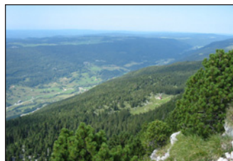
Ὅροσειρὰ τοῦ Ἰούρα.

Σὲ ἡλικία τριάντα πέντε ἐτῶν, ὁ Ρωμανὸς ἀνεχώρησε μόνος γιὰ τὰ πυκνὰ δάση ὄροσειρᾶς τοῦ Ἰούρα, παίρνοντας μαζί του μόνον τὴν Ἁγία Γραφή, τὸ Γεροντικὸν καὶ τὶς Κοινοβιακὰς Διατυπώσεις τοῦ Ἁγίου Κασσιανοῦ († Μνήμη: 29η Φεβρουαρίου, βλ. ἐδῶ ) καὶ ἐγκαταστάθηκε σὲ ἕναν ἀπομονωμένο καὶ δυσπρόσιτο τόπον, περικλειστο ἀπὸ τρία βουνά, στὴν συμβολὴ δύο χειμάρρων, τὸ ὁποῖο ὀνομαζόταν Κονταδίσκο. Γ ιὰ στέγη εἶχε τὰ ἀπλωμένα κλαδιὰ ἐνὸς μεγάλου ἐλάτου καὶ ἀφιέρωνε ὅλο τὸν χρόνον τοῦ στὴν προσευχὴ καὶ τὴν μελέτη, τρεφόμενος μὲ ἄγριους καρπούς.