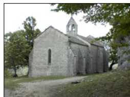
Ναὸς τοῦ Ἁγίου Ρωμανοῦ. Πράτζ, Γαλλία.

Ἐμπιστεύθηκε τὴν καθοδήγησι τῶν δύο Μονῶν στὸν Ἅγιο Λουπικῖνο, ὁ ὁποῖος διαμένον-