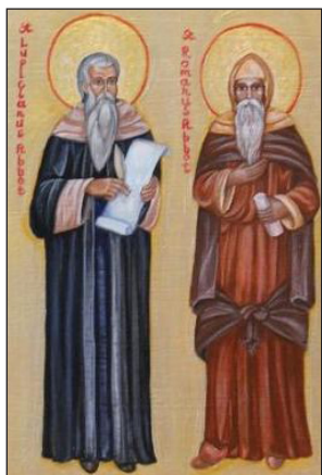
Οἱ Ὅσιοι Λουπικῖνος καὶ Ρωμανός.

Παρ' ὅλο πὸν ἦταν ὁ πρωτότοκος, ὁ Ρωμανὸς ἄφηνε συχνὰ στὸν Λουπικῖνο τὴν πρωτοβουλία στὰ διοικητικὰ ζητήματα, ἀλλὰ ὑπερίσχυε μὲ τὴν ἐπιείκεια καὶ τὴν ὑπομονή.