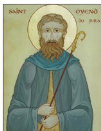
Ὁ Ὅσιος Ὅγενδιος ἢ Εὐγένδιος (Saint-Oyend).

τας συνήθως στὸν Λαυκῶννο τοποθέτησε ἕναν ἐπίτροπο στὸ Κονταδίσκο.