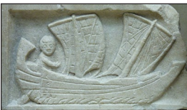
Πιθανῶς φτιαγμένο στὴν Τυνησία. Βρέθηκε στὴν Καρχηδόνα.

χθῆκε μὲ τὸ πλῆθος χωρὶς νὰ γίνῃ γνωστὴ. Κοντὰ στὴν πύλη τῆς Τιπάσα, σὲ μιὰ πλατεῖα, βρισκόταν ἓνα ἄγαλμα τῆς Διάνας [Ἀρτέμιδος, θεᾶς τοῦ κυνηγιοῦ]. Στα πόδια της ἔτρεχε μιὰ πηγὴ σὲ μιὰ μαρμάρινη λεκάνη. Στὴν θέα τοῦ εἰδώλου, ἡ εὐλογημένη Μαρκιέννα δὲν μπόρεσε νὰ μείνῃ ἀκίνητη