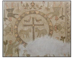
Χριστιανικὸ μωσαϊκὸ τῶν τεσσάρων Εὐαγγελιστῶν. Καρχηδόνα.

« Ἡ Ἁγία Μάρτυς Μαρκιέννα ἦταν πολίτης τοῦ δήμου Rusuccuru. Αὐτὴ ἡ ὁμορφὴ νεᾶνις, εὐγενικῆς καταγωγῆς, εἶχε ἀφιερωθῇ στὸν Θεό. Ἀπὸ περιφρόνησι γιὰ τὰ πλούτη, ἤλθε στὴν Καισάρεια, ὅπου ἐξῆσε σὲ ἓνα κελλί. Ἐφύλαξε παρθενία καὶ ἀπέφευγε τὶς ἀπολαύσεις καὶ τὶς φιλοδοξίες τῆς κοσμικῆς ζωῆς. Μίαν ἡμέρα ἐξῆλθε στὴν πόλι καὶ ἀναμίχθηκε μὲ τὸ πλῆθος χωρὶς νὰ γίνῃ γνωστὴ. Κοντὰ στὴν πύλη τῆς Τιπάσα, σὲ μιὰ πλατεῖα, βρισκόταν ἓνα ἄγαλμα τῆς Διάνας [Ἀρτέμιδος, θεᾶς τοῦ κυνηγιοῦ]. Στα πόδια της ἔτρεχε μιὰ πηγὴ σὲ μιὰ μαρμάρινη λεκάνη. Στὴν θέα τοῦ εἰδώλου, ἡ εὐλογημένη Μαρκιέννα δὲν μπόρεσε νὰ μείνῃ ἀκίνητη