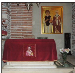
Ὁ Τάφος τοῦ Ἁγίου Κλήμεντος στὴν Ἐκκλησία τοῦ Ἁγίου Παντελεήμονος, Ἀχρίδα.

ἡλικία ἐξήτησε ἀπὸ τὸν Τσάρο Συμεὼν νὰ τὸν ἀπαλλάξει, προκειμένου νὰ ἀφιερῶσι τὶς τελευταῖες ἡμέρες τοῦ στὴν προσευχὴ στὴν Μονὴ τῆς Ἀχρίδος.