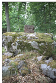
Πέτρα με την επιγραφή «Εκκλησάκι Ἁγίου Σβέν» (ἀριστερά). Τὰ ερείπια ἀπὸ τὸ Ἐκκλησάκι (δεξιά).