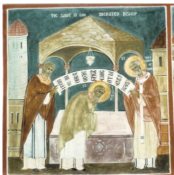
Ἡ εἰς Ἐπίσκοπον χειροτονία τοῦ Ἁγίου Κουθβέρτου, ἀπὸ τὸν Ἅγιο Θεόδωρο.

Ἐν συνεχείᾳ, γιὰ νὰ διευκολύνῃ τὸ ποιμαντικὸ ἔργο, διήρесе τὴν χώρα σὲ ἐνορίες καὶ ἐπισκοπές, στὶς ὁποῖες τοποθέτησε ἄξιους ποιμένας καὶ ἱερεῖς.