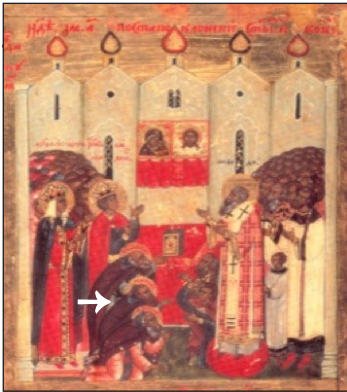
Ὁ Ὅσιος Μιχαὴλ, δεύτερος ἀπὸ κάτω.

Σ ὲ ἡλικία ὀγδόνα πέντε ἐτῶν, ὁ Μιχαὴλ βιαζόταν νὰ συναντήσῃ τὸν Θεόδωρο καὶ τὸν Θεοφάνη στὶς Οὐράνιες μονές, καὶ πληροφορήθηκε παρὰ Θεοῦ τὴν ἐπικειμένη ἐκδημία του.