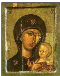
Ἱερά Εἰκὼν «Παναγία τοῦ Πέτρου». † Σύνταξις: 24η Αὐγούστου

Μετὰ ἀπὸ κάποιον διάστημα, ἀναχώρησε καὶ μετέβη στὸ Μονύδριο τῆς Μεταμορφώσεως, προκειμένου νὰ ζήσει ἐν ἡσυχίᾳ, ἡ ὁποία εὐνοεῖ τὴν προσευχή. Φιλοτεχνοῦσε εἰκόνες καὶ ὑπῆρξε ὁ γενάρχης τοῦ μοσχοβίτικου ρυθμοῦ τῆς ρωσικῆς εἰκονογραφίας.