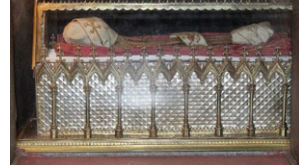
Λειψανοθήκη τοῦ Ἁγίου Ἀσχαρίου. Στὸν ναὸ τῶν Ἁγίων Ἀνσχαρίου καὶ Βερνάρδου. Ἀμβούργο.

Ὁ Ἅγιος Ἀνσχάριος ἐπέστρεψε στὴν Δανία, ὅπου ὁ νέος Βασιλεὺς Χόρικ Β' (854-870) εἶχε ἐγκαινιάσει τὴν βασιλεία του μὲ διωγμὸ τῶν Χριστιανῶν. Ὁ Ἅγιος τελικὰ κατάρθωσε νὰ τὸν μεταστρέψῃ στὸν Χριστιανισμό.