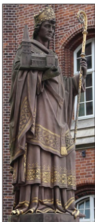
Άγαλμα τοῦ Ἁγίου Ἀνσχαρίου. Ἀμβούργο.

ἴδρουσι νοσοκομείων, γιὰ τὴν περίθαλψι τῶν πτωχῶν καὶ τὴν ἐξαγορὰ αἰχμαλώτων ἀπὸ τοὺς πειρατές. Δίπλα στὸν Καθεδρικὸ Ναό, τὸν ὁποῖον ἀνήγειρε στὸ Ἄμβρουργο, ὠργάνωσε ἓνα Μοναστήρι κατὰ τὸ πρότυπο τῆς Μονῆς τῆς Κορβίας, ὅπου καταρτίζονταν οἱ μελλοντικοὶ Ἱεραπόστολοι.