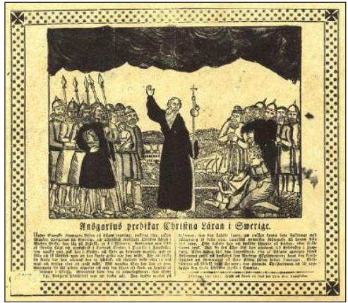
Ὁ Ἅγιος Ἀσχαριος βαπτίζει Σουηδοῦς.