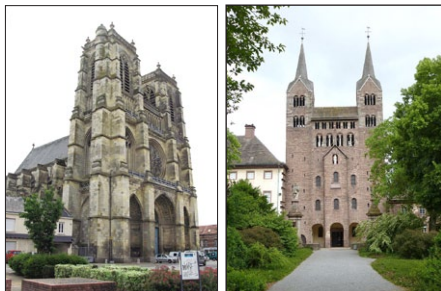
Μονὴ τῆς Κορβίας (ἀριστερά). Μονὴ τῆς Κορβίας ἢ Νεωτέρα (δεξιά).

Ὁ Δανὸς Βασιλεὺς Χάρολντ (812-813, 819-827), ποὺ εἶχε μόλις λάβει τὸ ἅγιο Βάπτισμα, ἐζήτησε ἀπὸ τὸν Λουδοβίκο Α΄ τὸν Εὐσεβῆ (814-840) νὰ στείλῃ Ἱεραποστόλους γιὰ τὴν διάδοσι τοῦ Εὐαγγελίου στὴν χώρα του καὶ τὸ ἔτος 826, ὁ Ἀνσχάριος μαζί με ἓναν ἄλλο Μοναχό, τὸν Αὐτβέρτο, ἐπε-