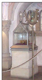
Λειψανοθήκη τοῦ Ἁγίου Ἀσχαρίου. Καθεδρικὸς ναός. Χίλντεσχαϊμ Γερμανία.

Ὁ νέος αὐτὸς Ἀπόστολος, ὁ ὁποῖος ἀνελπιῶς ἐκοπίασε γιὰ νὰ σπείρῃ τὸν σπόρο τοῦ Εὐαγγελίου στὶς χῶρες τοῦ Βορρᾶ, παρέδωσε τὴν ψυχὴ του στὸν Κύριο στὴν Βρέμη, στὶς 3 Φεβρουαρίου 865, καὶ σύντομα τιμήθηκε ὡς προστάτης Ἅγιος τῶν νέων αὐτῶν Ἐκκλησιῶν.