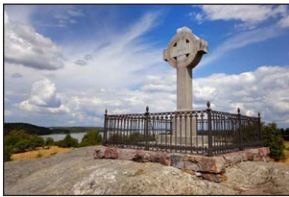
Μνημεῖο «ὁ Σταυρὸς τοῦ Ἁγίου Ἀσχαρίου» στὴν Νήσο Μπιγιόρκο.

Ἐ πεσαν θύματα πειρατῶν, οἱ ὁποῖοι τοὺς ἀπέσπασαν ὅ,τι εἶχαν καὶ δὲν εἶχαν. Κ ατόρθωσαν τελικὰ νὰ φθάσουν στὴν πόλι Μπίρκα, τῆς νήσου Μπιγιόρκο, σημαντικὸ πολιτικὸ καὶ ἐμπορικὸ κέντρο, καὶ νὰ προσηλυτίσουν στὴν πίστι τοῦ Χριστοῦ τὸν Χέριγκαρ, Διοικητὴ τῆς πόλεως, φίλο καὶ σύμβουλο τοῦ Βασιλέως Μπιγιόρν, ὁ ὁποῖος τοὺς ἐπέτρεψε νὰ κτίσουν ἐκεῖ τὸν πρῶτο Ναὸ στὶς σκανδιναβικὲς χώρες.