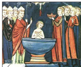
Ἡ βάπτισις τοῦ Βασιλέως Χλοδοβίκου.

Ἔτσι, κέρδισε τὴν ἐκτίμησι τοῦ Βασιλέως τῶν Βουργουνδῶν Γκοντεμπῶ καθὼς καὶ τοῦ Βασιλέως τῶν Φράγκων Χλοδοβίκου, τὸν