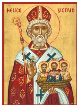
Ἱερά Εἰκὼν ἐκ τοῦ Ἀγιογραφείου τοῦ Ἱεροῦ Ἦσυχαστηρίου Ὁσίας Φιλοθέης, Σουηδία.

Μὲ διαταγὴ τοῦ Βασιλέως τῆς Νορβηγίας Ὁλαφ Α΄ Τρίγκβασον (Olaf Trygvason, 963-1000), ὁ Ἅγιος Σιγκφρίδιος ἔφθασε στὴν Νορβηγία τὸ 995 μαζὶ μὲ δύο Ἐπισκόπους καὶ τοὺς τρεῖς ἀνεψιούς του, οἱ ὁποῖοι ἦσαν Μοναχοὶ τῆς Ἀδελφότητος τοῦ Κλυνὺ (Cluny) καὶ ἀργότερα ἐμαρτύρησαν στὴν Σουη-