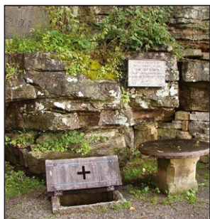
Ἡ Πηγή, στήν ὁποία ὁ Ἅγιος Σιγκφρίδιος βάπτισε τὸν Βασιλέα Ὀλαφ.

Σύντομα ἡ περιέργεια κυρίευσε τὸν Βασιλέα Ἅγιο Ὀλαφ Σκέτκονουνγκ (St. Olof Skötkonung, † Μνήμη: 29ῆ Ἰουλίου), καὶ ἀπέστειλε ἕναν ἐμπιστο σύμβουλο νὰ ἐρευνησῆ τὴν ὑπόθεσι.