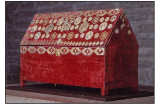
Λάρνακα του Άγίου Σιγκφριδίου Vadvstena klosterkyrka.

Τo κληροδότημα του Άγίου Σιγκφριδίου συνεχίσθη υπό την κηδεμονίαν των μαθητών του, των Έπισκόπων Δαυΐδ και Έσκίλ, οι όποιοι άργότερα έτελειώθησαν επίσης δια του μαρτυρίου.