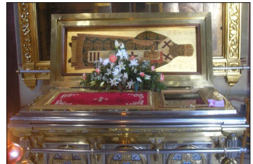
Τὰ Λείψανα τοῦ Ἁγίου Ἰννοκεντίου. Καθεδρικός Ναὸς Κοιμήσεως τῆς Θεοτόκου, Λαύρα Ἁγίου Σεργίου.

Τὸ 1862 μετέφερε τὴν ἔδρα του στὸ Μπλαγκοβεχτσένσκ 6 , μὲ σκοπὸ νὰ μείνῃ στὸ ἐξῆξ μονίμως. Γ ερασμένος πλεον, μὲ τὰ μάτια του νὰ πάσχουν ὕστερα ἀπὸ τόσες περιοδεῖες μέσα στὰ χιόνια, ἐξαντλημένος ἀπὸ τὶς κακουχίες, σκεφ-