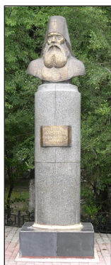
Προτομή τοῦ Ἁγίου Ἰννοκεντίου. Μπλαγκο- βεχτσένσκ.

Ἰωάννου ἦταν ἡ ἴδρυσι σχολείων, στὰ ὁποῖα παρεῖχαν στοὺς μαθητὲς δίγλωσσα σχολικὰ ἐγχειρίδια, στὰ ρωσικὰ καὶ στὰ τλίγκιτ, τὰ ὁποῖα συνέτασσε ὁ ἴδιος.