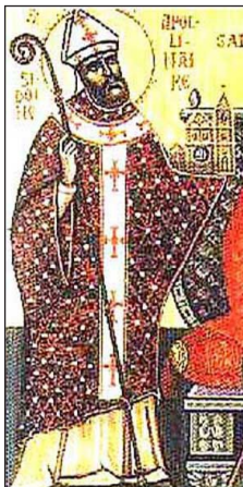
“Ὁ Ἅγιος Σιδώνιος Ἀπολλινάριος.

Μετὰ τὴν ἐπιστροφή του, ὁ Ἅγιος Λουῖπος, ἐπειδὴ κάποιοι τὸν ὑποπεύονταν, ὅτι συνεργαζόταν με τοὺς Οὐννους, ἀποσύρθηκε γιὰ δύο ἔτη στὸ ὄρος Λασουά (Lassois), ἐξήντα χιλιόμετρα περίπου ἀπὸ τὴν Τρουά, καὶ κατόπιν στὸ Μακόν (Macon). Ἐκεῖ ἐπετέλεσε θαυματουργικὰς ἰάσεις, οἱ ὁποῖες τὸν ἔκαναν τόσο ὀνομαστό, ὥστε ὁ Βασιλεὺς τῶν Ἀλαμανῶν ἐλευθέρωσε γιὰ χάρι του τοὺς αἰχμαλώτους, τοὺς ὁποῖους κρατοῦσε.