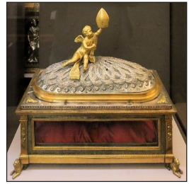
Ἡ Λειψανοθήκη τοῦ Ἁγίου Λούππου. Καθεδρικός ναὸς Τρουά.

Σὲ μία ἀπὸ τὶς ἐπιστολὰς, τὶς ὁποῖες τοῦ ἔστειλε ὁ Ἅγιος Σιδώνιος Ἀπολλινάριος, Ἐπίσκοπος