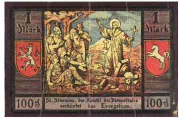
Παράσταση μὲ τὸν Ἅγιο Στοῦρμο σὲ χαρτονομίσματα τῆς πόλεως Νιεντερμαρσμπέργκ (Niedermarsberg, 1921), μὲ τὴν ἐπιγραφή: «Ὁ Ἅγιος Στοῦρμος, ὁ Ἀπόστολος τῆς κοιλάδας Ντιέμελ (Diemel), κηρύσσει τὸ Εὐαγγέλιο».

Τὸ 779, ὁ Ἅγιος Στοῦρμος συνώδευσε τὸν Καρλομάγνο στὴν Σαξονία, ὅμως ἠσθένησε καὶ ἔσπευσε νὰ ἐπιστρέψῃ στὴν μετάνοιά του, στὴν Φούλντα, ὅπου ἐκοιμήθη λίγο μετὰ τὴν ἐπιστροφή του, τὴν 17ην Δεκεμβρίου, ἀφοῦ συνήθροισε καὶ ἐνουθέτησε γιὰ τελευταία φορὰ τὴν Ἀδελφότητα.