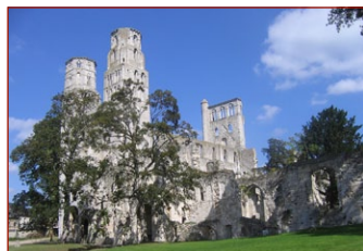
Τὰ εἱρεπία τῆς Μονῆς στὸ Ζουμέζ.

Τὸ 740 χειροτονήθηκε Ἱερομόναχος στὴν Φρίτσαρ. «Ὅταν εἶχαν περάσει σχεδὸν τρία χρόνια ἀπὸ τὴν Χειροτονία του εἰς τὴν ἱερωσύνη, κηρύττων καὶ βαπτίζων, ἔλαβε θεόθεν τὴν ἔμπνευσι νὰ ἀναλάβῃ τὴν αὐστηρὴ ζωὴ ἐνὸς ἐρημίτου. Αὐτὸ τὸ ὄραμα τὸν στοιχειωνε κάθε στιγμὴ τῆς ἡμέρας, ἕως ὅτου μὲ θεϊκὴ παρόρμησι ἄνοιξε τὴν καρδιά του εἰς τὸν πνευματικὸ του διδάσκαλο, τὸν Ἀρχιεπίσκοπο Βονιφάτιο. Ὅταν ἔμαθε τὴν πρόθεσί του, ὁ Ἅγιος Ἱεράρχης κατάλαβε ἀμέσως, ὅτι ὁ Κύριος εἶχε καταδεχθῆ νὰ τὸν ἀγγίξῃ μὲ τὴν Χάρι Του, καί, βλέπων ὅτι ἡ ἔμπνευσις αὐτὴ προήρχετο ἀπὸ τὸν Θεό, τὸν ἐνεθάρρυνε καὶ ἐγινε ὁ κύριος ὑποστηρικτὴς τοῦ ὁράματός του. Τοῦ ἔδωσε λοιπὸν δύο συντρόφους, τοὺς συνεβούλευσε προσεκτικὰ καί, ἀφοῦ προσευχήθηκε, τοὺς ἔδωσε τὴν εὐλογία του νὰ ἀνακαλύψουν ἕναν κατάλληλο τόπο γιὰ τὴν ἱδρυσι τῆς Μονῆς.