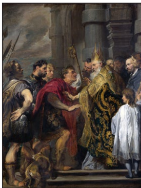
Ἡ ἀπαγόρευσις εἰσόδου τοῦ Θεοδοσίου στὸν Ναὸ ἀπὸ τὸν Ἀμβρόσιο. Ἐλαιογραφία τοῦ Βὰν Ντάϊκ. ΙΖ' αἰ.

Τ ὸν Φεβρουάριο τοῦ 391, ἀφοῦ ἔκλεισε δύο χρόνια παραμονῆς στὸ Μεδιόλανο καὶ σίγουρα ὑπὸ τὴν καθοδήγηση καὶ τὴν ἐπιτροπὴ τοῦ Ἐπισκόπου Ἀμβροσίου 73 , ἐξέδωσε τὸν πρῶτο αὐστηρὸ ἀντιπαγανιστικὸ Νόμο, σύμφωνα μὲ τὸν ὁποῖο ἀπαγορευόντουσαν οἱ αἱματηρὲς θυσίες, ἡ προσέγγιση σὲ βωμοὺς, ὁ καθαγιασμὸς τῶν ναῶν καὶ ἡ προσφορὰ εὐλάβειας σὲ εἰδωλα πὸ εἶχαν φτιαχθεῖ ἀπὸ ἀνθρώπους. Ὁ Νόμος προέβλεπε καὶ αὐστηρὰ πρόστιμα σὲ πρόσωπα πὸ κατεῖχαν