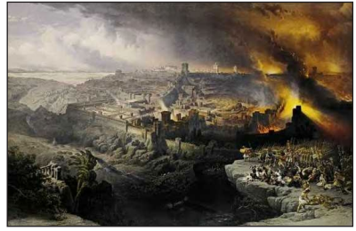
Ἡ σφαγὴ τῆς Θεσσαλονίκης.

Ἡ διαταγή τῆς καταστροφῆς εἰδωλολατρικῶν ναῶν, ἀπὸ τὸν Αὐτοκράτορα Θεοδοσίο, θὰ εἶχε πρωτίστως καταγραφεῖ ἀπὸ τοὺς ἱστορικοὺς καὶ τοὺς λόγιους παγανιστὲς τῆς ἐποχῆς του καὶ δευτερευόντως ἀπὸ τοὺς Νόμους τοῦ Κράτους. Ὁ Ζώσιμος καὶ ὁ Λιβάνιος κατηγορηματικὰ τὸ ἀρνοῦνταν. Ἐ πιπλέον, δὲν διασώθηκε κάποιο Διάταγμα πὸ νὰ ὀριζε τὴν καταστροφὴ τῶν εἰδωλολατρικῶν ναῶν. Ἐ πομένως, οἱ ὅποιες καταστροφὲς ἱερῶν ἔγιναν ἀπὸ ομάδες Χριστιανῶν καὶ Μοναχῶν 71 .