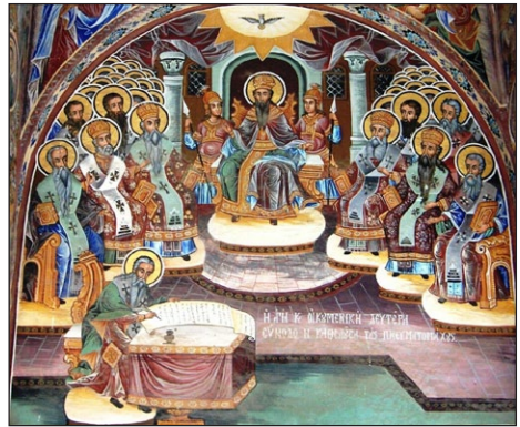
Ἡ Ἁγία Β' Οἰκουμένηκη Σύνοδος.

Δύο χρόνια ἀργότερα ὁ Αὐτοκράτορας συγκάλεσε νέα Σύνοδο, μετὰ ἀπὸ εἰσήγηση τοῦ Ἀρχιεπισκόπου Νεκταρίου, γιὰ νὰ συζητηθεῖ τὸ ζήτημα τῆς μὴ ἐπιστροφῆς στοὺς κόλπους τῆς Ἐκκλησίας, τῶν κορυφαίων ἐκπροσώπων τῶν διαφόρων αἰρετικῶν παρατάξεων 29 . Ὁ Θεοδοσίος, μετὰ τὴν ἐνέργεια αὐτῆ, πίστευε πῶς θὰ μπορούσε νὰ πείσει τοὺς αἰρετικούς νὰ δεχθοῦν τὴν Ὁρθόδοξη Πίστη 30 . Στὴν Σύνοδο, ὅλοι οἱ ἡγέτες ποὺ κλήθηκαν, τῶν αἰρετικῶν παρατάξεων, ἀντέδρασαν καὶ ὑπέβαλαν χωριστὲς Ὁμολογίες πίστεως 31 . Ὁ Αὐτοκράτορας ἔσχισε ὅλες τὶς αἰρετικὲς Ὁμολογίες πίστεως, ἐνῶ διακήρυξε τὴν