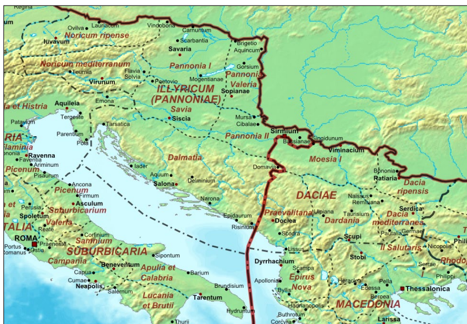
Ὁ Θεοδοσίος ἦταν διοικητὴς τοῦ στρατοῦ στὴν Μοισία Α΄ τὸ 374.

Μόνο αὐτοὶ ποὺ πίστευαν στὴν θεότητα τοῦ Πατέρα, τοῦ Υἱοῦ καὶ τοῦ Ἁγίου Πνεύματος θὰ ἀποκαλοῦνταν μὲ τὸν τίτλο τοῦ καθολικοῦ Χριστιανοῦ ( Christianorum catholicorum ). Οἱ αἰρετικοὶ ἀποκαλοῦνταν ἀνόητοι καὶ τρελοὶ, ἐνῶ τοὺς ἀπαγορευόταν νὰ καλοῦνται «ἐκκλησία» ( nec conciliabula eorum ecclesiarum nomen accipere ) 11 .