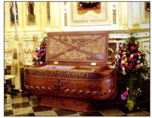
Ἡ Λειψανοθήκη τοῦ Ἁγίου Θεοδώρου, τοῦ Ναυάρχου.

Ἐκοιμήθη τὴν 2αν Ὀκτωβρίου 1817, καὶ τιμᾶται ὡς Ἅγιος τῆς Ρωσικῆς Ἐκκλησίας.