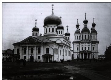
Τὸ Ἐρημητήριο τοῦ Σάρωφ, φωτογραφία ἀρχῆς τοῦ Κ' αἰ.

Στὰ τέλη τοῦ ΙΖ' αἰ., ὁ Ἱερομόναχος Ἰσαάκιος, ἠγούμενος τῆς Ἱερᾶς Μονῆς Εἰσοδίων τῆς Θεοτόκου στὴν πόλι Ἀρζαμάς, ἔγινε συνασκητῆς δύο ἐρημιτῶν, τῶν Θεοδοσίου καὶ Γερασίμου, οἱ ὁποῖοι ἀσκήτευαν ἀπομονωμένοι στὰ δάση. Οἱ ἐρημίτες ἔπειτα ἀπεχώρησαν· τότε ὁ π. Ἰσαάκιος ἔδωκε παραίτησιν ἀπὸ τὴν ἡγουμενίαν καὶ ἵδρυσε στὸ τόπο αὐτὸ τὸ Ἐρημητήριο τοῦ Σάρωφ.