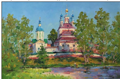
Ἡ Ἱερὰ Μονὴ Γεννήσεως τῆς Θεοτόκου, Σαναζάρ.

Τ ὰ ὑπόλοιπα ἀπὸ τὰ τότε 954 Μοναστήρια στὴν Ρωσία ἔμειναν χωρὶς μέσα ἐπιβιώσεως· τὰ περισσότερα ἔκλεισαν ἢ μεταστράφηκαν σὲ ἐνοριακοὺς Ναοὺς. Ἐ τσι, ὡς ἀποτέλεσμα τῆς ὑπογραφῆς μιᾶς γυναικός, τὰ δύο τρίτα τῶν Ἱερῶν Μονῶν τῆς Ρωσικῆς Αὐτοκρατορίας ἐξαφανίσθησαν.