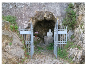
Σπήλαιο Άγιου Φαντίνου. Όρος Κελλεράνο.