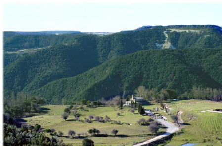
Ὁ Ναὸς τοῦ Ἁγίου Νικοδήμου, στὸ ὁμώνυμο Ὅρος.