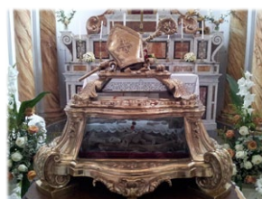
Τὰ Λείψανα τοῦ Ἁγίου Νικοδήμου.