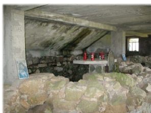
Έρείπια τής Μονής του Όσιου Νικοδήμου. Όρος Κελλεράνο.