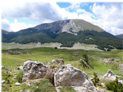
Τὸ Μερκούριον Ὅρος.

Ἀ πὸ ἔνωρις, ὁ Ὅσιος διακρίθηκε γιὰ τὴν αὐστηρὴ ἀσκητικὴ του