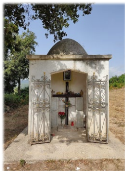
Ὁ τόπος, ὅπου ἐκοιμήθη ὁ Ἅγιος Νικόδημος.

Σήμερα σώζεται τὸ «Μονοπάτι τῶν Ἑλλήνων» (Sentiero dei Greci, γνωστὸ καὶ ὡς Μονοπάτι San Nicodemo ἢ Μονοπάτι «Seja»): στὴν ἀρχαιότητα, τὸ μονοπάτι ἦταν ὁ σημαντικότερος δρόμος γιὰ τοὺς Λοκροὺς τῆς Μεγάλης