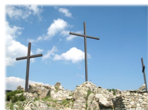
Τρεις σταυροί στην πλαγιά του Όρους Κελλεράνο, μέ κατεθύννσι προς τὸ Τυρρηνικό, τὸ Ἴόνιο καὶ τὸ Ἱερὸ τής Μονής.