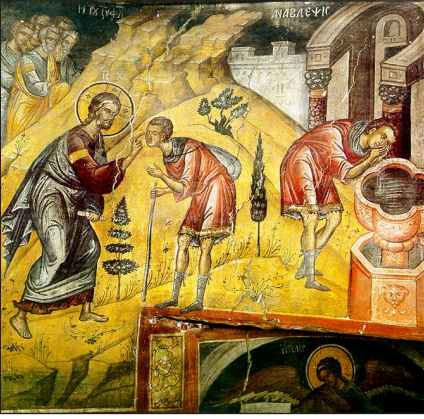
Τοιχογραφία (1527), διὰ χειρὸς Θεοφάνους τοῦ Κρητός, Ἱ. Μ. Ἁγίου Νικολάου Ἀναπαυσᾶ, Μετέωρα.

Εἰς ταύτην οὖν ἀπέστειλεν ὁ Ἰησοῦς τὸν τυφλόν, ἵνα νίψῃ τοὺς ὀφθαλμοὺς αὐτοῦ, τοὺς ἐκ τοῦ πηλοῦ κεχρισμένους, οὐχ ὅτι τὸ ὕδωρ αὐτῆς εἶχε τοιαύτην δύναμιν, ὥστε ἀνοίγειν τυφλῶν ὀφθαλμούς, ἀλλ' ἵνα καὶ τοῦ ἀποσταλέντος ἡ πίστις καὶ ἡ ὑπακοὴ δοκιμασθῇ, καὶ τὸ θαῦμα κατασταθῇ ἐπισημότερον, γνωστὸν εἰς πάντας, καὶ ἀναμφίβολον. Ἐπίστευσε λοιπὸν ὁ τυφλὸς εἰς τοῦ Ἰησοῦ τοὺς λόγους, ὑπήκουσεν εἰς τὸ πρόσταγμα αὐτοῦ, ὑπῆγεν, ἐνίφθη, καὶ ὑπέστρεψεν οὐκ ἔτι τυφλός, ἀλλ' ὑγιής καὶ βλέπων.