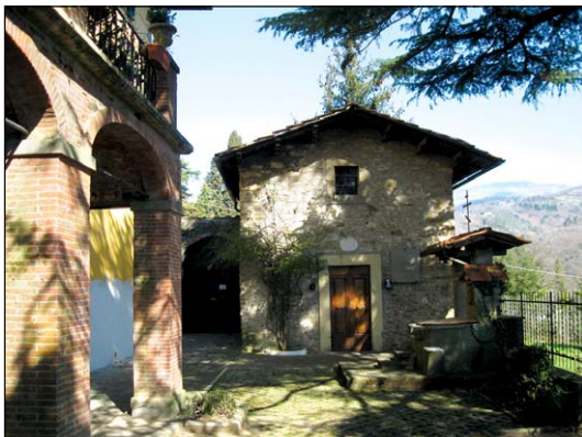
Ἱερὰ Μονὴ Ὁσίου Σεραφεῖμ τοῦ Σάρωφ Πιστόια Ἰταλίας.