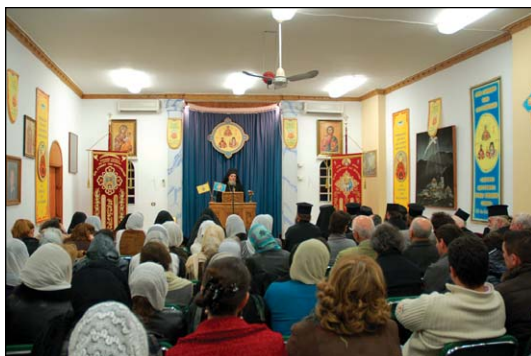
Κυριακὴ τῆς Ὁρθοδοξίας 2011 εἰς Κολωνὸν Ἀθηνῶν.