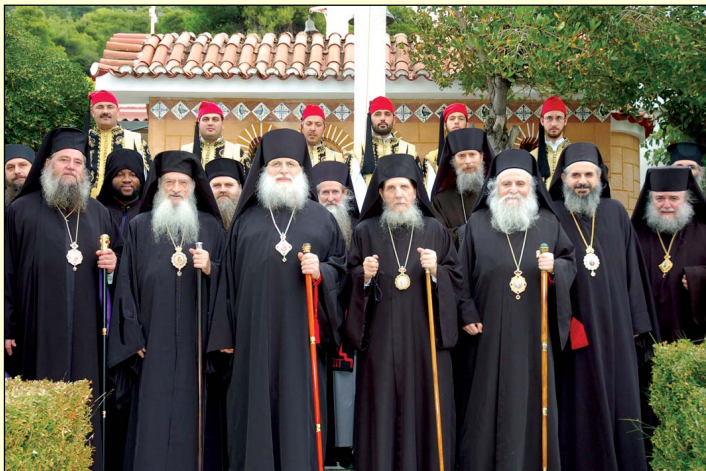
Ἀπὸ τὴν Πανήγυριν τῆς Ἱερᾶς Μονῆς τῶν Ἁγίων Κυπριανοῦ καὶ Ἰουστίνης φυλῆς Ἀττικῆς, 2.10.2011.