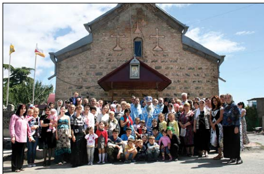
Ἱερός Καθεδρικός Ναός Γεννήσεως τῆς Θεοτόκου εἰς Τοχίνβαλι Νοτίου Ὀσσετίας.