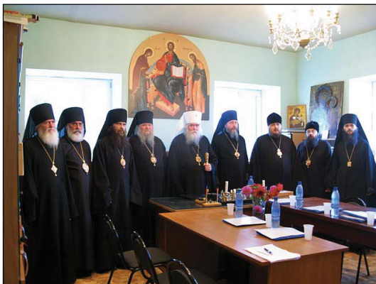
Ἡ Ἱερὰ Σύνοδος τῆς Ἱεραρχίας τῆς Ρωσικῆς Ὁρθοδόξου Ἐκκλησίας ἐν Διασπορᾷ.