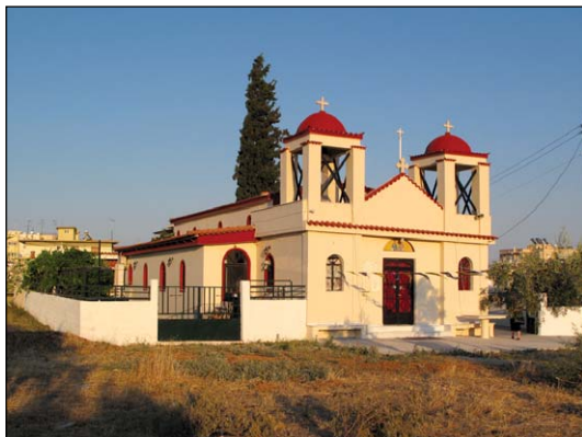
Ἱερός Ναός Ἁγίων Ἀναργύρων Ἐλευσίνος Ἀττικῆς.