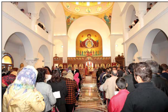
Ἐσωτερικὴ ἄποψις τοῦ Προσκυνηματικοῦ Ναοῦ τῆς Ἱερᾶς Μονῆς τῶν Ἁγίων Κυριακοῦ καὶ Ἰουστίνης Φυλῆς.