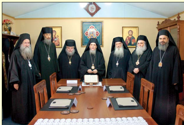
Συνεδρίασις τῆς Ἱεραῆς Συνόδου τῶν Ἐνισταμένων (Ὀκτώβριος 2011).