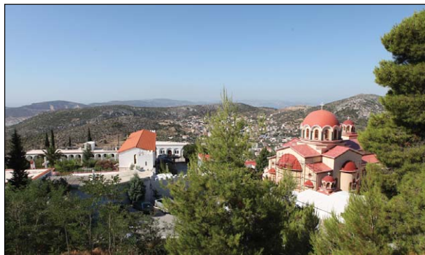
Ἐξωτερικὴ ἄποψις τοῦ Προσκυνηματικοῦ Ναοῦ τῆς Ἱερᾶς Μονῆς τῶν Ἁγίων Κυριακοῦ καὶ Ἰουστίνης Φυλῆς Ἀττικῆς.