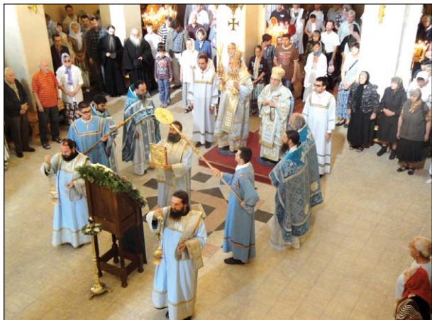
Άπό την Πανήγυριν τῆς Κοιμήσεως τῆς Θεοτόκου εἰς Σόφιαν Βουλγαρίας, 15.8.2011 ἐκ.ἡμ.