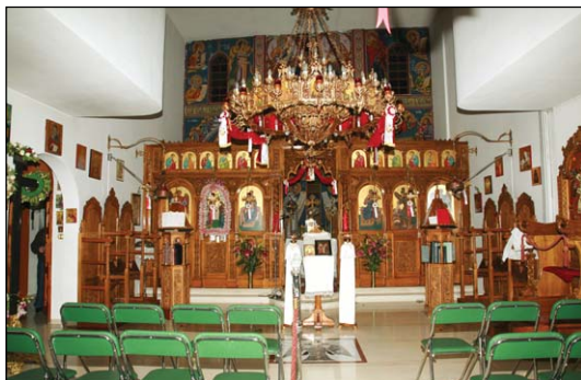
Ἱερός Ναός Εὐαγγελισμοῦ τῆς Θεοτόκου, ἐντὸς τοῦ ὁμωνύμου Πνευματικοῦ Κέντρου εἰς Κολωνὸν Ἀθηνῶν.