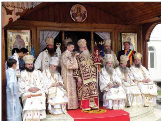
Συλλειτουργία μετὰ τῶν Ἀδελφῶν ἡμῶν Ἐκκλησιῶν εἰς Σλατιοάραν Ρουμανίας (15.6.2011) καὶ εἰς Σόφιαν Βουλγαρίας (15.5.2011).