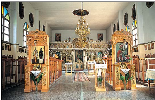
Ἱερός Ναός Ἁγίων ἸΒ' Ἀποστόλων Κυμίνων Θεσσαλονίκης.