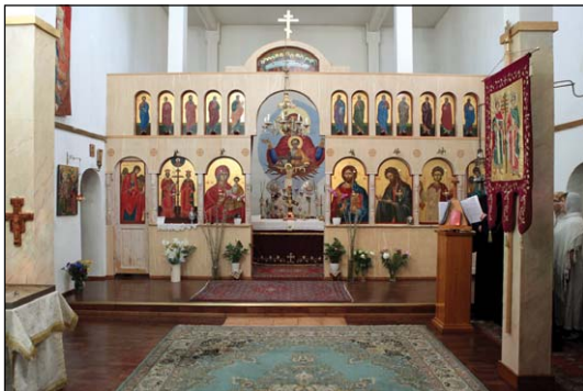
Ἱερὸς Ναὸς Ἁγίων Κωνσταντίνου καὶ Ἑλένης εἰς Βάομπεργκ Στοκχόλμης.