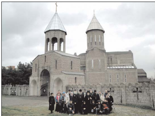
Ἱερός Ναός Παναγίας Πορταϊτίσσης εἰς Γκλντάνι Τιφλίδος.