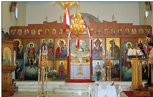
Ἱερός Ναός Ἁγίων Ἀναργύρων εἰς Σύδνεϋ Αὐστραλίας.