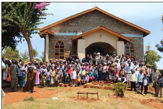
Ἱερός Ναός Ἀποστόλου Παύλου εἰς Κάντζα Ἐμποῦ Κένυας.