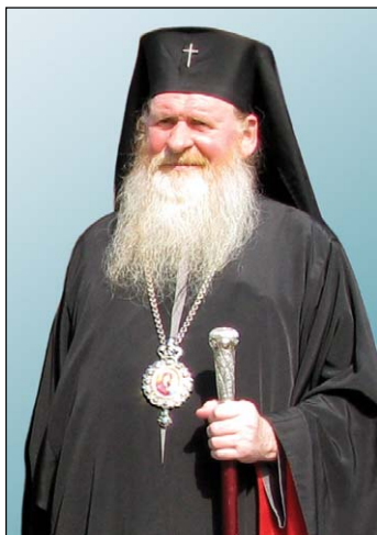
Ὁ Σεβασμ. Μητροπολίτης κ. Βλάχιος