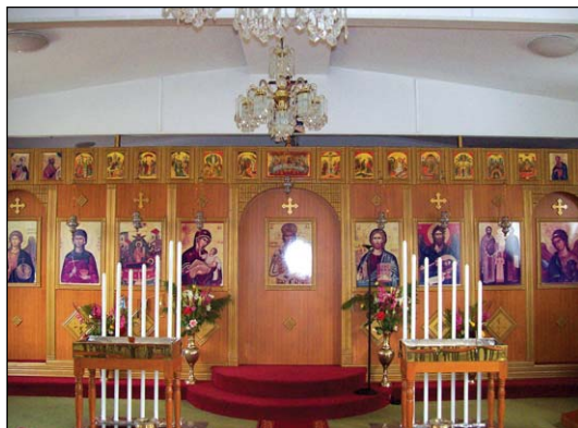
Ἱερός Ναός Κοιμήσεως τῆς Θεοτόκου εἰς Μελβούρνην Αὐστραλίας.