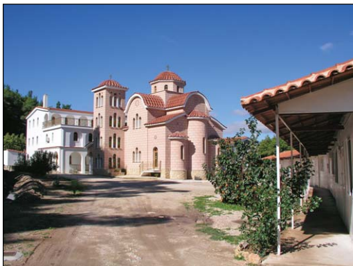
Τερά Μονή Ἁγίων Ἀγγέλων Ἀφιδνῶν Ἀττικῆς.