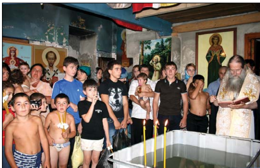
Βαπτίσεις εἰς Τοχίνβαλι Νοτίου Ὀσσετίας.