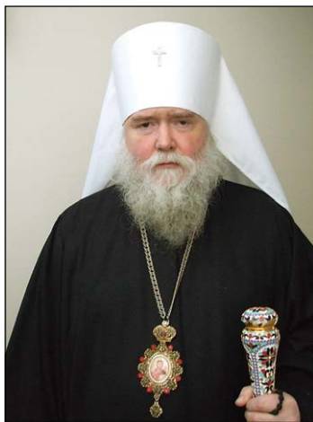
Ὁ Σεβ. Μητροπολίτης κ. Ἀγαθάγγελος, Πρωθιεράρχης τῆς Ρ.Ο.Ε.Δ.