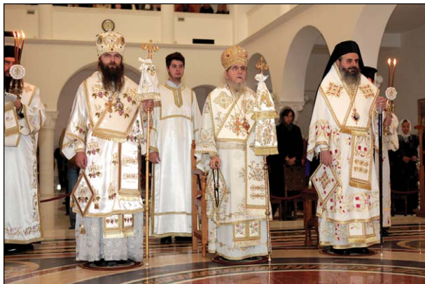
Λειτουργικός Συνεορτασμός τῶν Ἑλλήνων Ὁρθοδόξων Ἐνισταμένων μετὰ τοῦ Ἀρχιεπισκόπου Ἁγίας Πετρούπολεως καὶ Β. Ρωσίας κ. Σωφρονίου τῆς Ἀδελφῆς ΡΟΕΔ εἰς Φυλὴν Ἀττικῆς τὸν Ὀκτώβριον τοῦ 2011.