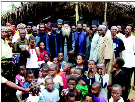
Έραποστολική Κοινότης εις Κονγκό.