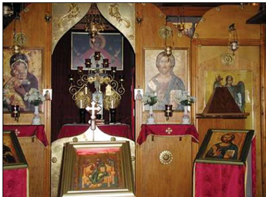
Ἱερὸς Ναὸς Ἁγίων Κυπριανοῦ καὶ Ἰουστίνης εἰς Κάλιαρι Σαρδινίας.