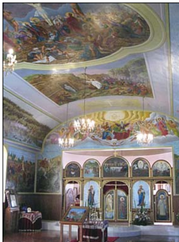
Ἱερός Ναός Ἁγίου Γεωργίου Τροπαιοφόρου εἰς Κανμπέρραν Αὐστραλίας.