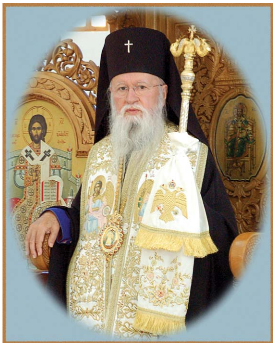
Ὁ Σεβασμιώτατος Μητροπολίτης † Ὁρωποῦ καὶ Φυλῆς κ. Κυπριανὸς Πρόεδρος τῆς Ἱερᾶς Συνόδου τῶν Ἐνισταμένων