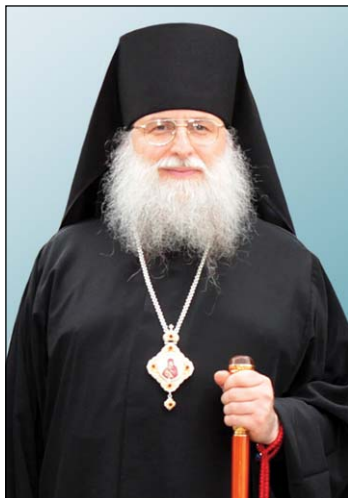
Ὁ Σεβασμ. Ἐπίσκοπος Τριάδιτσα κ. Φώτιος