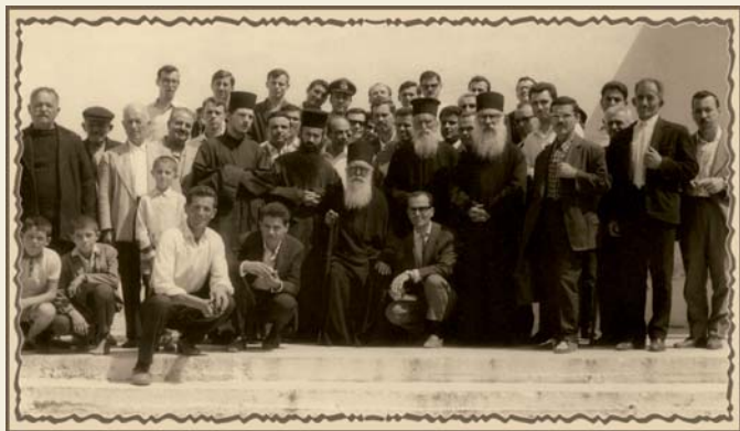
1968. Πλάτανος Τρικάλων. Μετὰ τὴν Θ. Λειτουργίαν.

• Τὸ ἐν ἀνάθεμα εἶναι τῆς Ζης [Ἁγίας] Οἰκουμενικῆς Συνόδου, ἣτις ὀρίζει: