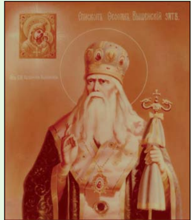
Ὁ Ἅγιος Ἐπίσκοπος Θεοφάνης ὁ Ἐγκλησιος

τὴν προτροπή του σὲ ὅλους τοὺς Χριστιανούς χωρὶς διάκρισι. Πάνω ἀπ' ὅλα, προτρέπει ὅλους τοὺς Χριστιανούς νὰ προσεύχωνται ἀδιαλείπτως (Α΄ Θεσσαλ. ε΄ 17). Τὸ νὰ προσεύχεσαι ὅμως ἀδιαλείπτως εἶναι δυνατόν μόνον διὰ τῆς προσευχῆς τῆς καρδιάς. Αὐτὸ σημαίνει ὅτι ἡ προσευχή τῆς καρδιάς εἶναι ἀναγκαία γιὰ ὅλους τοὺς Χριστιανούς, καὶ ἐφ' ὅσον εἶναι ἀναγκαία κανεὶς δὲν μπορεῖ νὰ εἰπῆ ὅτι εἶναι ἀδύνατον νὰ γίνῃ, διότι ὁ Θεὸς δὲν ζητεῖ αὐτὸ πού εἶναι ἀδύνατον νὰ γίνῃ. Βέβαια εἶναι δύσκολη, ἀλλὰ τὸ νὰ εἰπῆς, ὅτι εἶναι ἀδύνατον νὰ γίνῃ εἶναι λάθος. Πάνω ἀπ' ὅλα, κάθε καλὸ εἶναι δύσκολο, καὶ πολὺ περισσότερο αὐτὸ μπορεῖ νὰ εἰπωθῆ γιὰ τὴν προσευχή, ἡ ὁποία εἶναι ἡ πηγή γιὰ μᾶς κάθε καλοῦ καὶ ἡ σταθερὴ του ὑποστήριξις.