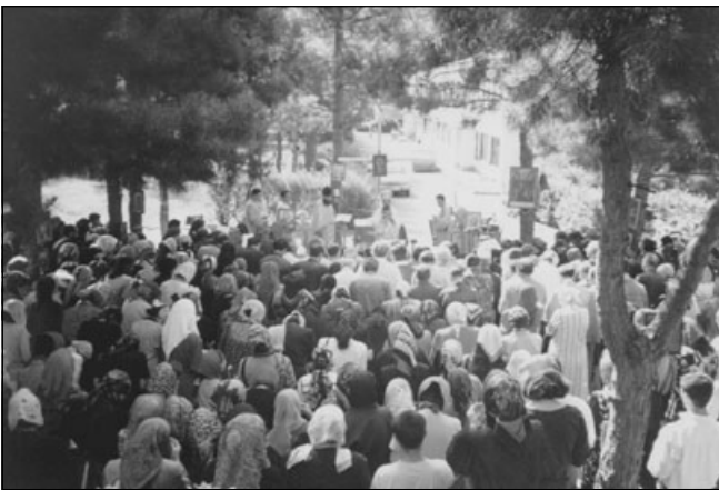
«Ὁρθόδοξος Ἐπαρχία Γκλντάνη»: ὑπαίθρια ἀρχιερατικὴ Θ. Λειτουργία ἀπὸ τὸν Θεοφίλ. Ἐπίσκοπο Μεθώνης κ. Ἀμβρόσιο τὸν Μάιο τοῦ 1997 στὴν Τιφλίδα τῆς Γεωργίας.

Ἦδη τὸ 1995, ὁ πρῶτος Κληρικὸς καὶ μεγάλο μέρος Γεωργιανῶν πιστῶν στὴν πρωτεύουσα Τιφλίδα, μετὰ ἀπὸ ἐπανειλημμένα διαδήματα στὸν πατριάρχη κ. Ἡλία, τὰ ὁποῖα ἔμειναν ἀναπάντητα ἢ καὶ περιεφρονήθησαν σκαιῶς, διέκοψαν κοινωνία μὲ τὸ Γεωργιανὸ Πατριαρχεῖο καὶ ἄρχισαν ὁμολογιακὸ ἀγῶνα Πίστεως, καταγγέλοντες τὴν αἵρεσι καὶ ζητοῦντες δόξηθαι καὶ συμπαράστασι ἀπὸ Ὁρθοδόξους πιστοὺς ἄλλων χωρῶν.