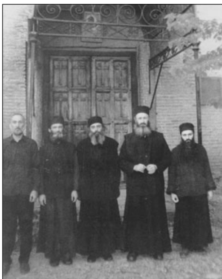
Ἡ Ἀδελφότης τῆς Ἱεράς Μονῆς τοῦ Ἁγίου Σίου Μγκβίμε Γεωργίας.

Σ τὰ ἀρχαῖα Σόδομα ζούσε ὁ δίκαιος Λῶτ καὶ ἡ οἰκογένειά του. Ὁ μακρόθυμος Θεὸς μας, ἀναμένων τὴν μεταστροφή, τὴν ἀλλαγὴ τῆς καρδίας τῶν Σοδομιτῶν, τοὺς παρεῖχε ὅλα ὅσα ἐχρειάζοντο: ἀέρα, νερό, τροφή... τὴν ἴδια τὴν ζωή. Ὁ Λῶτ ἦταν γι' αὐτοὺς ἕνα ἀσφαλὲς παράδειγμα δικαιοσύνης, ἕνα ὑπόδειγμα διορθώσεως. Ἀλλά, ματαιῶς. Τὸ μέτρο τῆς ἀνομίας καὶ τῆς ἀμαρτίας ὑπερκέλισε· ὁ Κύριος ἐξέβαλε τὴν οἰκογένεια τοῦ Λῶτ καὶ κατέστρεψε τὰ Σόδομα διὰ πυρός, λαμβάνων ἔτσι πίσω τὴν ζωή, τὴν ὁποῖαν Αὐτὸς εἶχε δώσει.