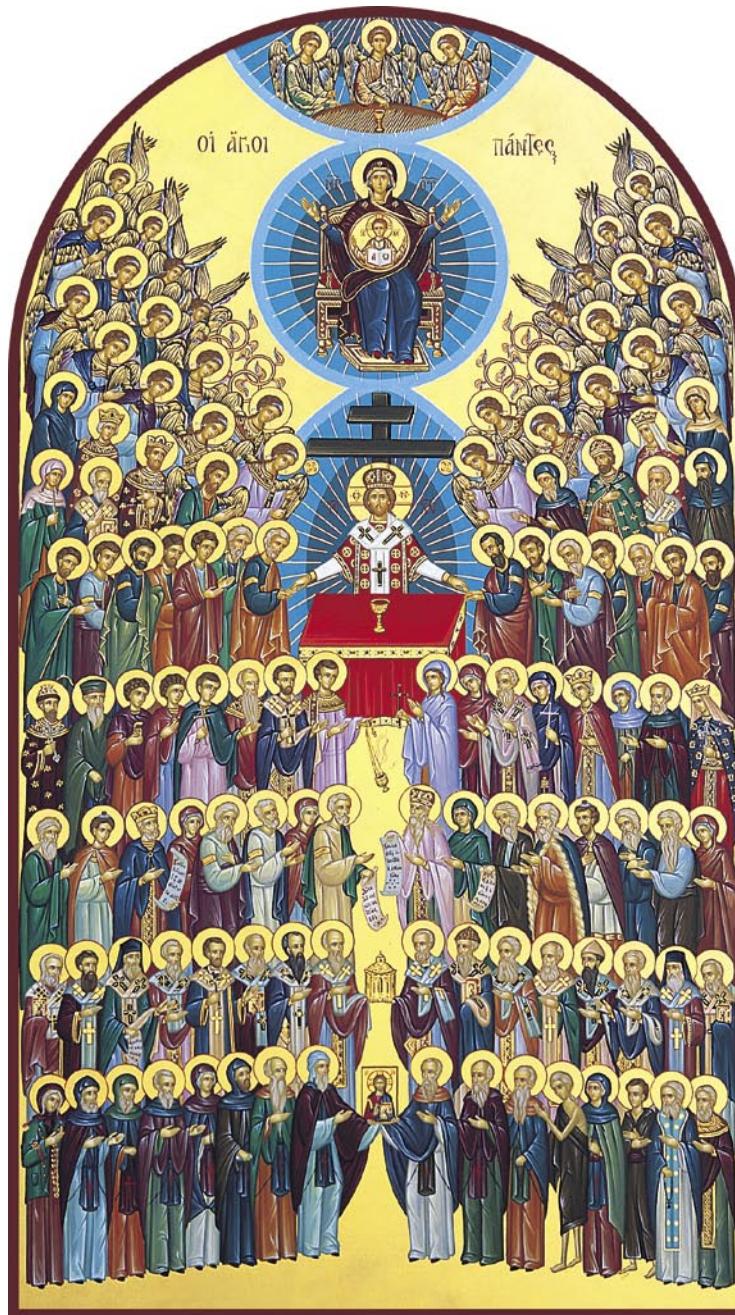
Ἡ Ἱερὰ Εἰκὼν. (ἁ Δοκίμιο)