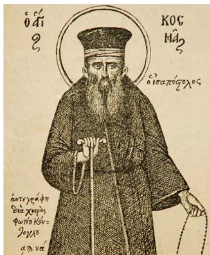
«διὰ χειρὸς Φωτίου Κόντογλου»

(βλ. www.synodinresistance.org/Θεολογία/Μελέτες/Εἰκονολογία/Ἡ Ἱερὰ Εἰκὼν τῶν Ἁγίων Πάντων . Ἀπόπειρα γιὰ μία νέα προσέγγισι).