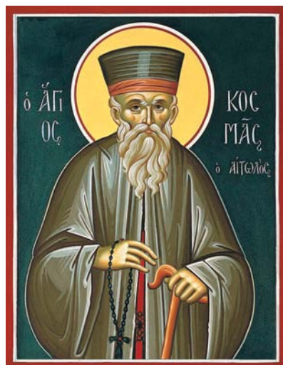
«Ἀγιογραφικὸς Οἶκος Ἀγιοκυπριανιτῶν»