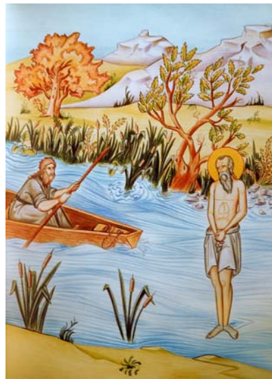
Στιγμιότυπα ἀπὸ τὸν βίον τοῦ Ἁγίου.