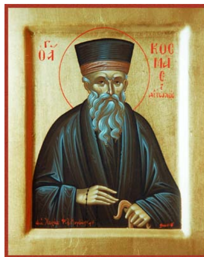
«διὰ χειρὸς Φιλ. Μαρκοπούλου»