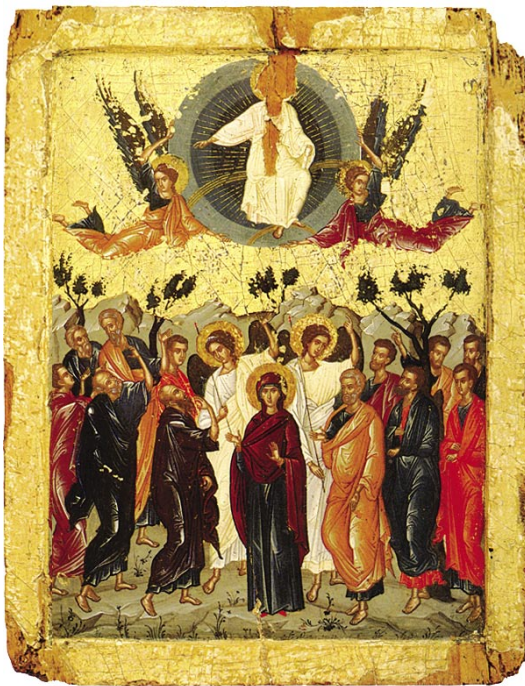
Ἡ Ἀνάληψις Χεῖρ Θεοφάνους τοῦ Κρητός. 1545

Ἡ αὐτὴ λύσις συναντᾶται πολλὰς φορὰς σὲ σπουδαῖες παλαιές, ἀλλὰ καὶ σύγχρονες Ἱερὰς Εἰκόνες, ἰδιαίτερος δὲ στὴν ἔξοχη Ἱερὰ Εἰκόνα τῆς Ἀναλήψεως τοῦ Σωτῆρος τοῦ Θεοφάνους τοῦ Κρητός, ἡ ὁποία ἀπετέλεσε καὶ τὴν κύρια πηγὴ ἐμπνεύσεως γιὰ τὴν ἐπιλογή μας αὐτή.