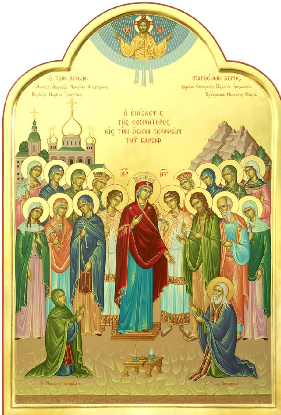
Ἡ Ἱερὰ Εἰκὼν. (Μεγάλῃ ἀνάλυσις)