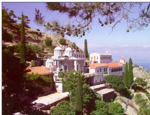
Ἱερὰ Σκήτη τῶν Ἁγίων Πατέρων τῶν ἐν Χίῳ. Προβάτειον Ὄρος Χίου.

Ἡ ἀποτυχία του ὅμως αὐτῆ, λόγῳ κακῆς συνεργασίας, δὲν τὸν πτοεῖ, ἀντίθετα τὸν προσανατολίζει σὲ καινούργια ἔπαλξη. Τὸ Σπήλαιο τῶν Ἁγίων Πατέρων τοῦ Προβατείου Ὁρους τῆς Χίου τὸν ἀναμένει, γιὰ νὰ τὸ διευρύνει καὶ νὰ τὸ ἀνακαινίσει, νὰ κτίσει δεῦτερο Καθολικό, νὰ