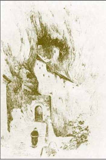
Τὸ Ἄνω Μοναστήρι τοῦ Ὀστρογκ (1895).

τοῦ Νίκσιτς, ὅπου εἶχε τὴν ἔδρα του, καὶ νὰ εὖρη καταφύγιο σὲ ἕναν ἀπόκρυφο τόπο. Ἔτσι ἀποσύρθηκε σὲ μία σπηλιὰ στὸ Πιεσίβιτς κάτω ἀπὸ τὸ βουνὸ Ζαγάρατς, ὅπου τακτοποίησε ἕνα κελλὶ καὶ ἔμεινε γιὰ ἀρκετὸ χρόνο. Κάποιοι ἡλικιωμένοι κάτοικοι ἀπὸ τὰ περίχωρα τὸν συνεβούλευσαν νὰ μεταφερθῆ στὸ πλησιόχωρο Μοναστήρι τοῦ Ὀστρογκ.