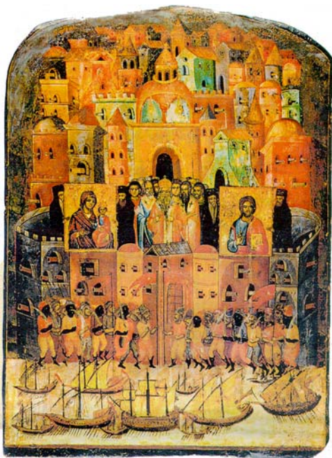
Ἡ πολιορκία τῆς Κωνσταντινουπόλεως ἀπὸ τοὺς Ἀβάρους τὸν 7 ο αἰ., σὲ Εἰκόνα τοῦ 17 ο αἰ. Στὰ τείχη ἔχουν τοποθετηθῆ Εἰκόνες τῆς Παναγίας καὶ τοῦ Χριστοῦ, ὥστε νὰ ἀποτραπῆ ἡ εἴσοδος τῶν εἰσβολέων.

Εἶναι γεγονός, ὅτι παρὰ τὴν ἀντίθεση, ὁ διχασμὸς μπορεῖ νὰ ἀποβεῖ εὐεργετικὸς πρὸς τὸ Ἔθνος, ὅταν οἱ ἀντιτιθέμενοι ταυτί- ζονται μὲ αὐτὸ καὶ ἐργάζονται γι' αὐτό, μὴ ταυτιζόμενοι μὲ τὰ