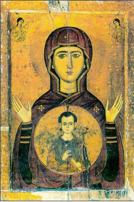
Εικόνα τῆς Παναγίας Βλαχερνίτισσας, τέλη ΙΓ' αἰ.

τὸ ἀγόρι σφάχθηκε ἀπὸ τὸ σουλτάνο, γιὰτὶ ἀρνῆθηκε νὰ ὑποκύψει στὶς ἀκόλαστες ἐπιθυμίες του» (Ράνσιμαν, σ. 203).