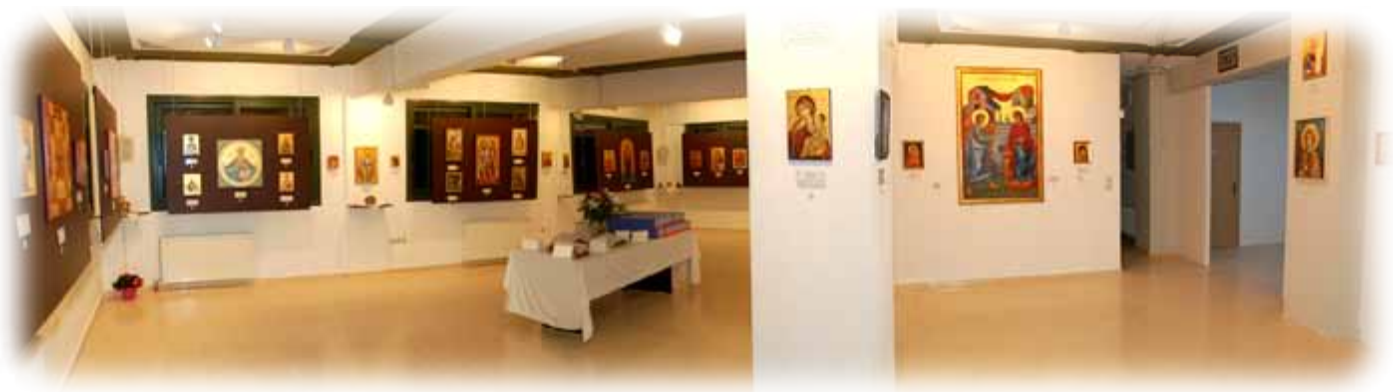
Αΐθουσα Έκθεσης Α΄ στο ισόγειο του κτιρίου.