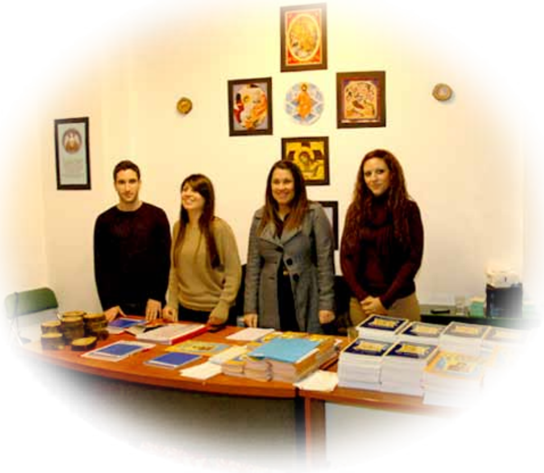
«Κολμπρι»-Έθελοντές του «Αγίου Φιλαρέτου» στην Γραμματεία της Έκθεσης, εξυπηρετούν με χαρά και καλή διάθεση.