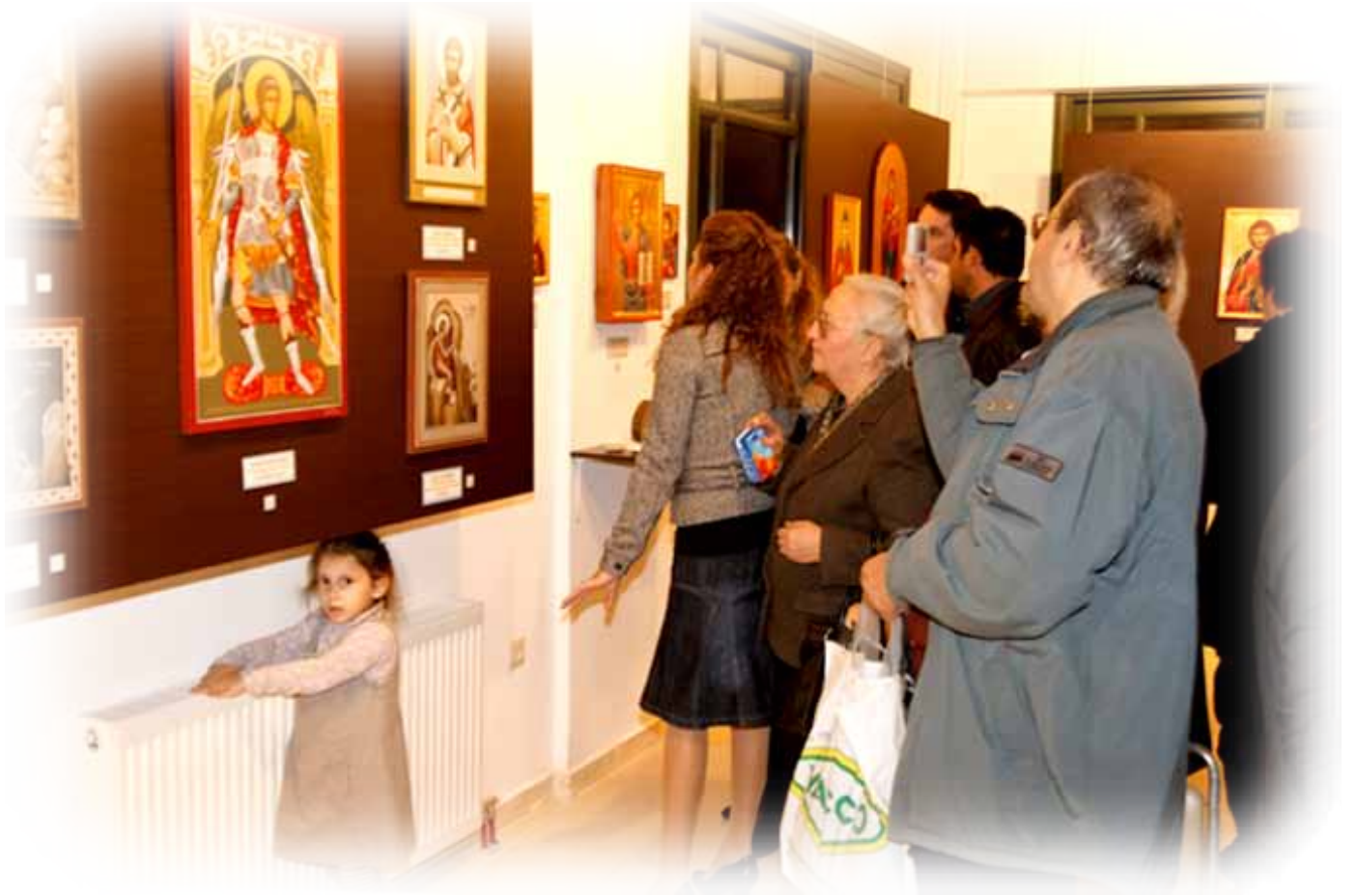
Περίηγηση στὸν θαυμαστὸ κόσμο τῶν Ἱερῶν Εἰκόνων