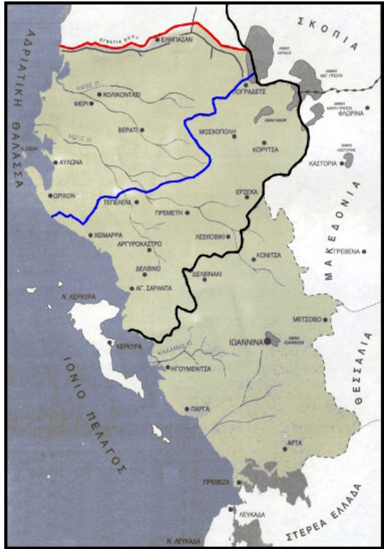
Χάρτης τῆς ἐνιαίας Ἡπείρου.

Ἀποδεικνύει ὅτι ἡ ἐθνικότητα τῶν ἐποίκων μας πού ἦρθαν ὡς εὐλογία καὶ κάλυψαν ἀνάγκες σὲ ἐργατικὰ χέρια καὶ σὲ πολεμιστές, στὴν συντριπτικὴ τους πλει-