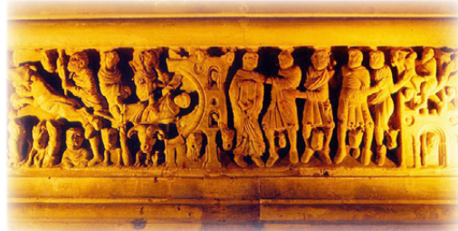
Ἡ Σαρκοφάγος τοῦ Ἁγίου Σατουρνῖνου.

Ὅταν οἱ Ἅγιοι ἔφθασαν στὴν Ἀρελάτη, στὸν Σατουρνῖνο ἀνετέθησαν οἱ περιοχὲς τοῦ Λανγκεντόκ, τῆς Γασκώνης (ΝΔ Γαλλία) καὶ ἡ ἰσπανικὴ μεθόριος.