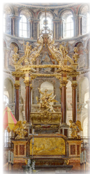
Ἱερά Λάρνακα τῶν τιμίων Λειψάνων τοῦ Ἁγίου Σατουρνίνου.

Τῶ δὲ ἐν Τριάδι Παναγίῳ Θεῷ, τῶ ἐνδοξαζομένῳ ἐν τοῖς Ἁγίοις Αὐτοῦ, προσκύνησις καὶ εὐχαριστία, εἰς τοὺς αἰῶνας τῶν αἰῶνων. Ἀμήν!